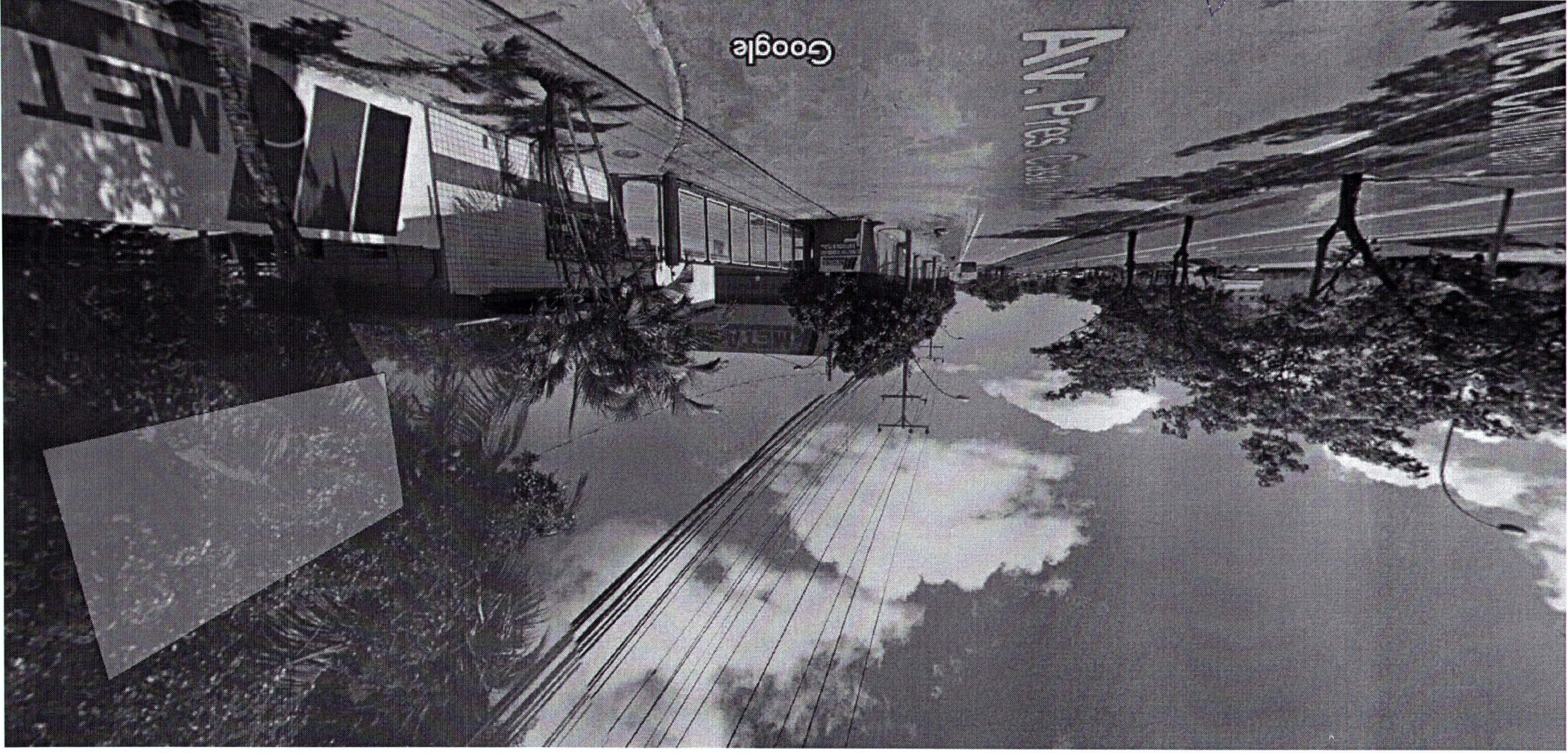
Captura da imagem: jan 2014 © 2015 Google