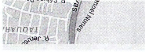
Street View - jan 2014