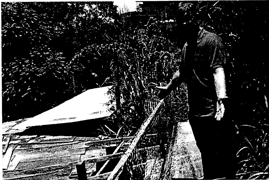
Passagens em tapumes gerando sérios riscos de acidentes