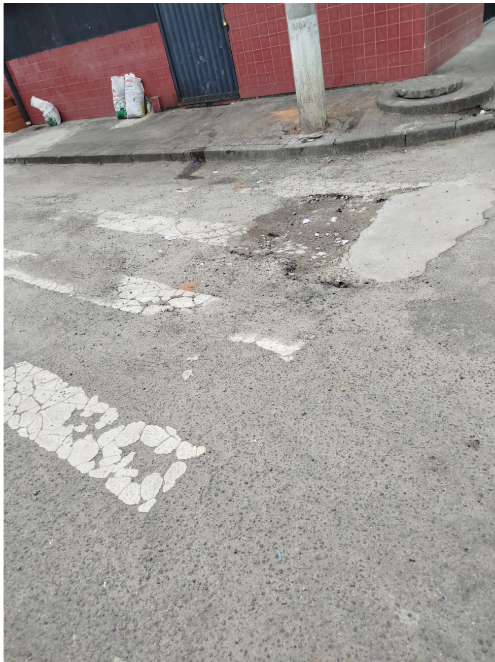
Imagem 3 - Vista da Avenida Mestre Álvaro, s/n, Colina de Laranjeiras, Serra ES.

Rua Major Pissarra, 245 - CENTRO – SERRA - ES – CEP: 29.176-020 – TEL (27) 3251-8300 E-mail: gabinetegeorge@camaraserra.es.gov.br / Site: www.camara.serra.es.gov.br