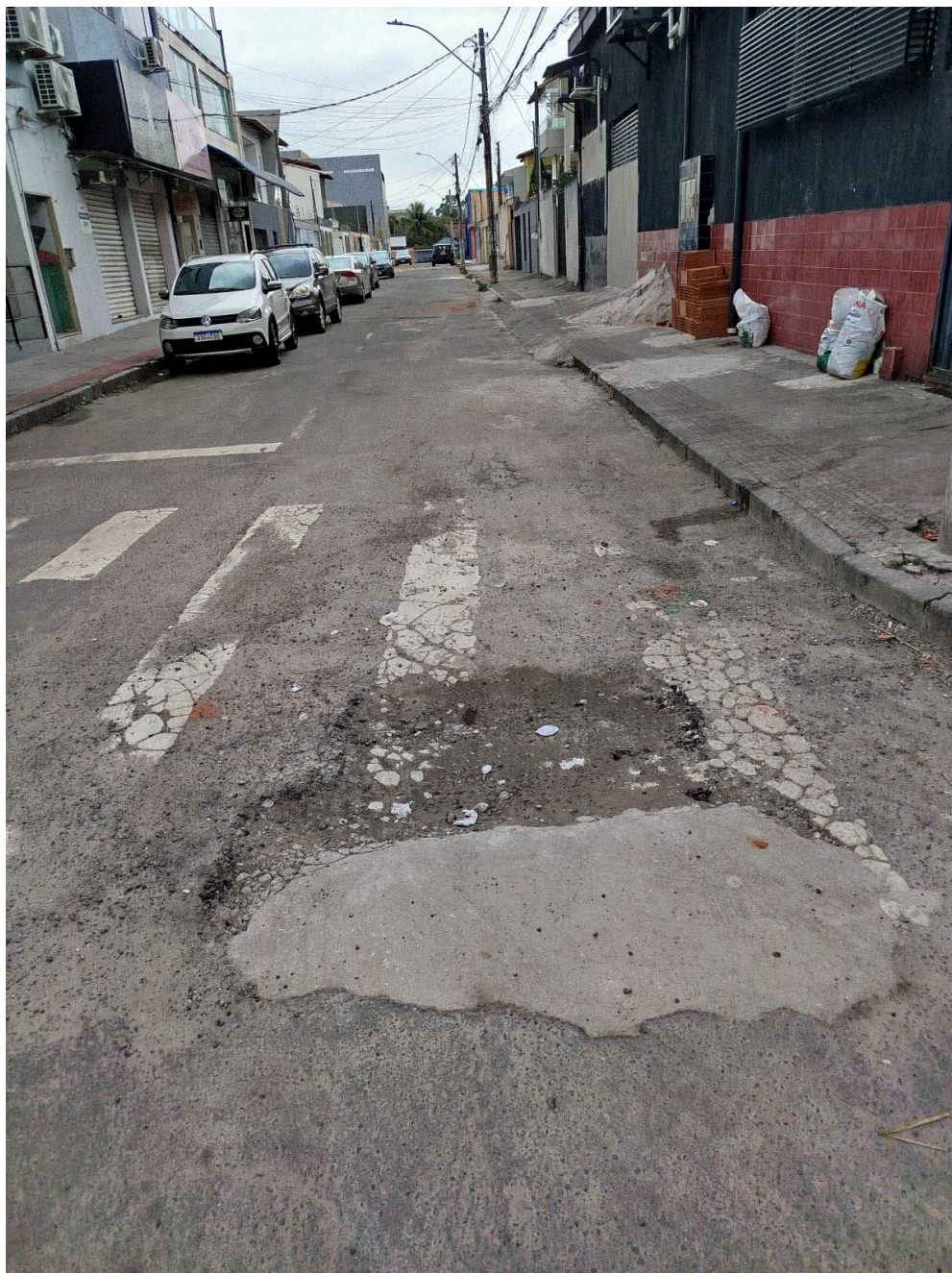
Imagem 2 - Vista da Avenida Mestre Álvaro, s/n, Colina de Laranjeiras, Serra ES.

Rua Major Pissarra, 245 - CENTRO – SERRA - ES – CEP: 29.176-020 – TEL (27) 3251-8300 E-mail: gabinetegeorge@camaraserra.es.gov.br / Site: www.camara.serra.es.gov.br