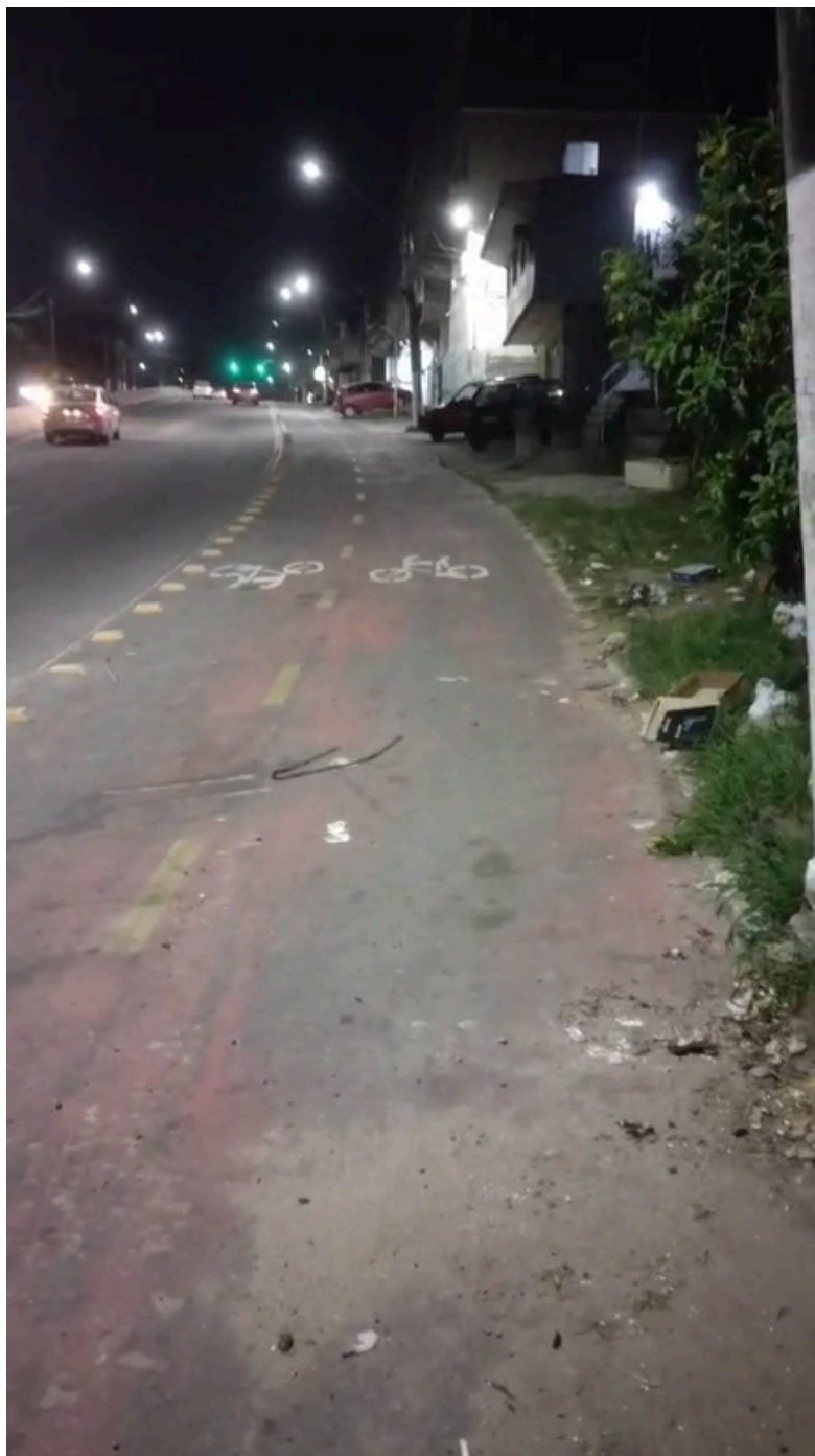
Imagem 4 - Avenida Norte Sul, 22, Colina de Laranjeiras, Serra/ES.

Rua Major Pissarra, 245 - Centro – Serra/ ES – CEP: 29.176-020 – TEL (27) 3251-8300 E-mail: gabinetegeorge@camaraserra.es.gov.br / Site: www.camara.serra.es.gov.br