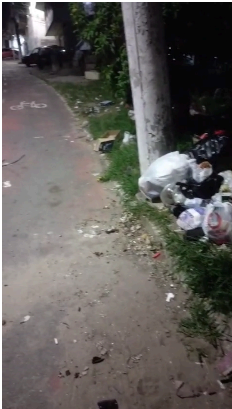
Imagem 3 - Avenida Norte Sul, 22, Colina de Laranjeiras, Serra/ES.

Rua Major Pissarra, 245 - Centro – Serra/ ES – CEP: 29.176-020 – TEL (27) 3251-8300 E-mail: gabinetegeorge@camaraserra.es.gov.br / Site: www.camara.serra.es.gov.br