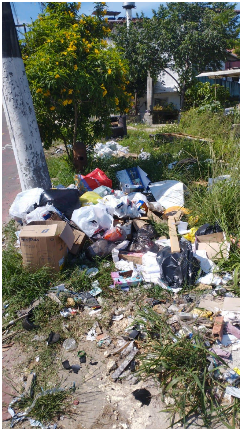
Imagem 2 - Avenida Norte Sul, 22, Colina de Laranjeiras, Serra/ES.

Rua Major Pissarra, 245 - Centro – Serra/ ES – CEP: 29.176-020 – TEL (27) 3251-8300 E-mail: gabinetegeorge@camaraserra.es.gov.br / Site: www.camara.serra.es.gov.br