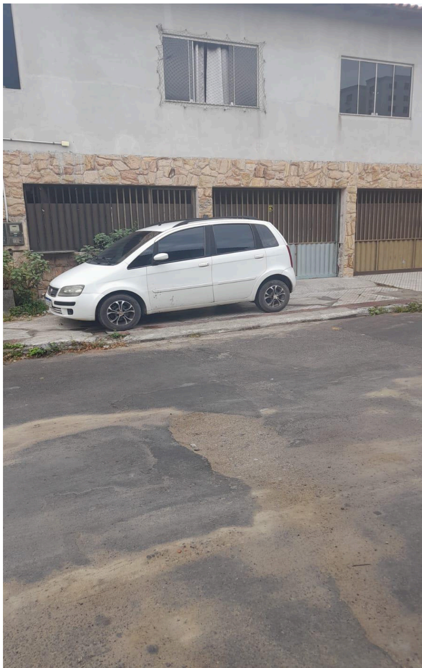
Imagem 3 - Vista da Rua Guimarães Rosa, s/n, Chácara Parreiral, Serra - ES.

Rua Major Pissarra, 245 - Centro – Serra/ES – CEP: 29.176-020. Tel.: (27) 3251-8300 E-mail: gabinetegeorge@camaraserra.es.gov.br / Site: www.camara.serra.es.gov.br