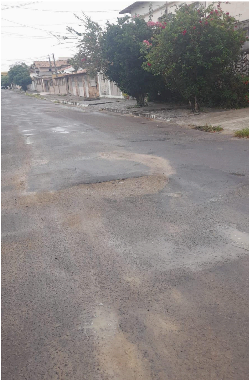
Imagem 2 - Vista da Rua Guimarães Rosa, s/n, Chácara Parreiral, Serra - ES.

Rua Major Pissarra, 245 - Centro – Serra/ES – CEP: 29.176-020. Tel.: (27) 3251-8300 E-mail: gabinetegeorge@camaraserra.es.gov.br / Site: www.camara.serra.es.gov.br