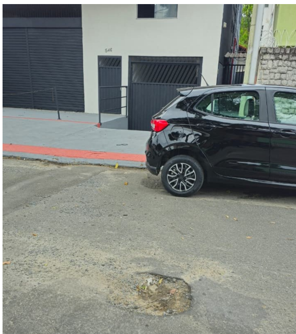
(Rua Rui Barbosa)