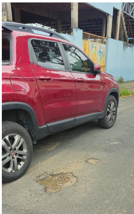
(Rua Eduardo Xible)