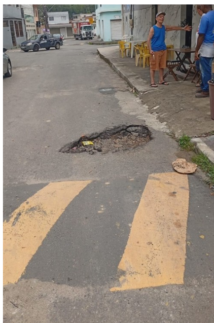
(Rua Rio Jaguaribe)

Ademais, no momento da execução dos serviços se houver a necessidade de reparo em mais pontos na Região, além daqueles pedidos ainda pendentes, devem ser prontamente incluídos nos serviços como forma de promover, preventivamente, a segurança viária em nosso Município (CRFB, art.37, §6º c/c LOM, art. 30, XXIII, "e").