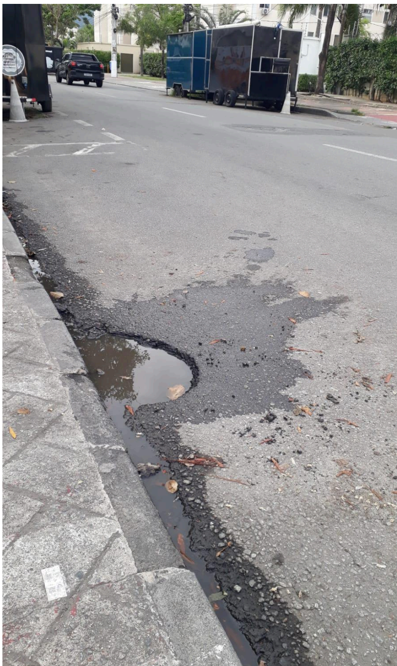
Imagem 2 - Vista da Rua Dom Pedro II, nº 155, Colina de Laranjeiras, Serra - ES.

Rua Major Pissarra, 245 - Centro – Serra/ES – CEP: 29.176-020. Tel.: (27) 3251-8300 E-mail: gabinetegeorge@camaraserra.es.gov.br / Site: www.camara.serra.es.gov.br