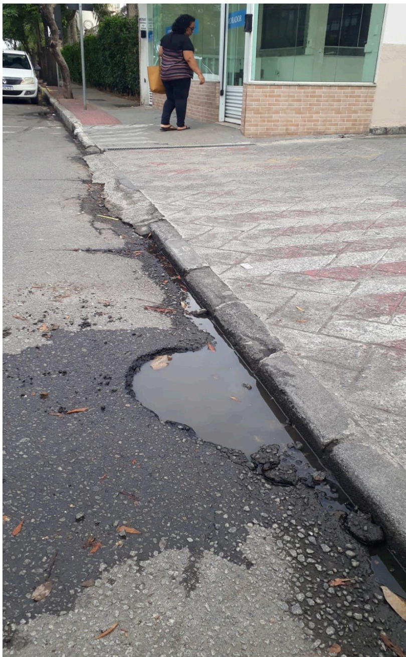
Imagem 3 - Vista da Rua Dom Pedro II, nº 155, Colina de Laranjeiras, Serra - ES..

Rua Major Pissarra, 245 - Centro – Serra/ES – CEP: 29.176-020. Tel.: (27) 3251-8300 E-mail: gabinetegeorge@camaraserra.es.gov.br / Site: www.camara.serra.es.gov.br