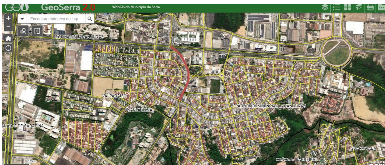
Imagem 1 - Localização da Av. Primeira Avenida, nº 114, Parque Res. Laranjeiras, Serra - ES.

Rua Major Pissarra, 245 - Centro – Serra/ES – CEP: 29.176-020. Tel.: (27) 3251-8300 E-mail: gabinetegeorge@camaraserra.es.gov.br / Site: www.camara.serra.es.gov.br