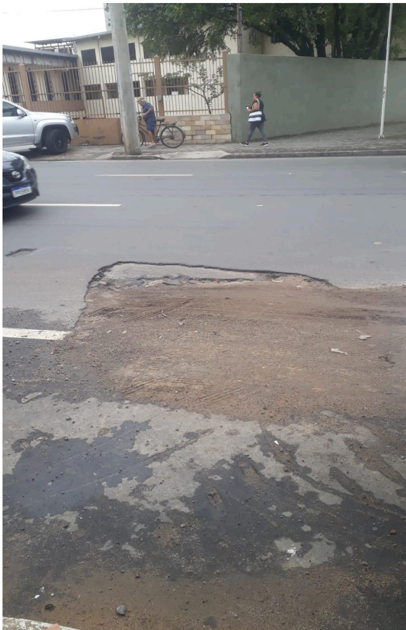
Imagem 3 - Vista da Av. Primeira Avenida, nº 114, Parque Res. Laranjeiras, Serra - ES.

Rua Major Pissarra, 245 - Centro – Serra/ES – CEP: 29.176-020. Tel.: (27) 3251-8300 E-mail: gabinetegeorge@camaraserra.es.gov.br / Site: www.camara.serra.es.gov.br