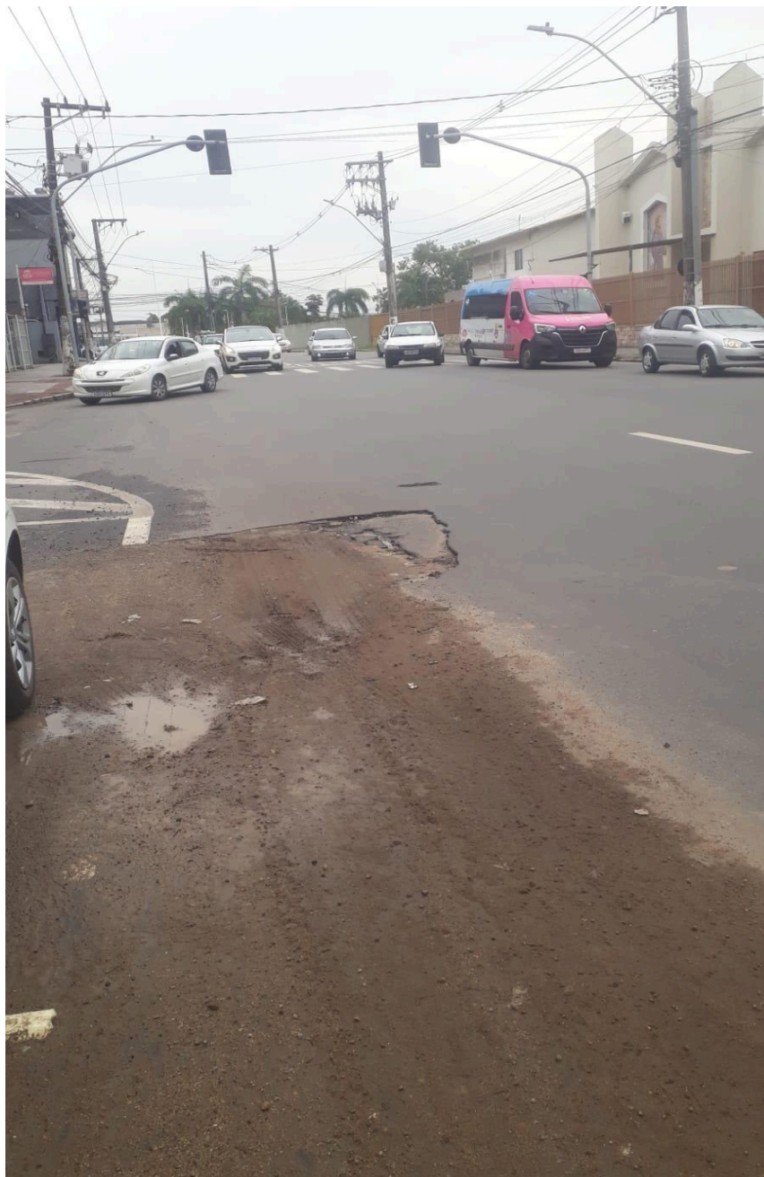
Imagem 4 - Vista da Av. Primeira Avenida, nº 114, Parque Res. Laranjeiras, Serra - ES.

Rua Major Pissarra, 245 - Centro – Serra/ES – CEP: 29.176-020. Tel.: (27) 3251-8300 E-mail: gabinetegeorge@camaraserra.es.gov.br / Site: www.camara.serra.es.gov.br