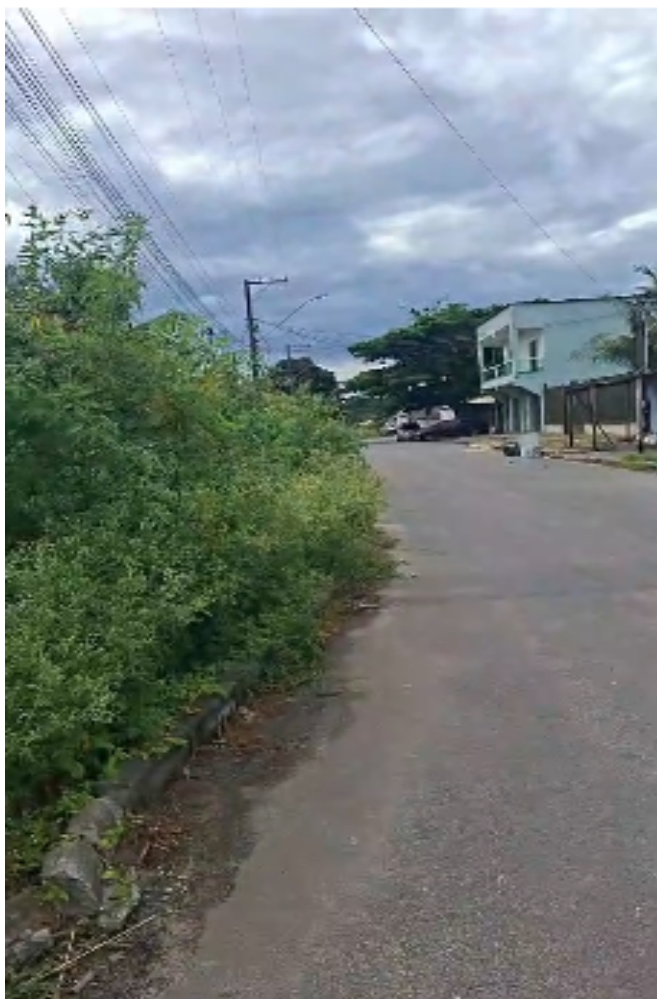
Imagem 2 - Vista da Rua São Lucas, s/n, São Francisco, Serra - ES.

Rua Major Pissarra, 245 - Centro – Serra - ES – CEP: 29.176-020 – TEL (27) 3251-8300 E-mail: gabinetegeorge@camaraserra.es.gov.br / Site: www.camaraserra.es.gov.br