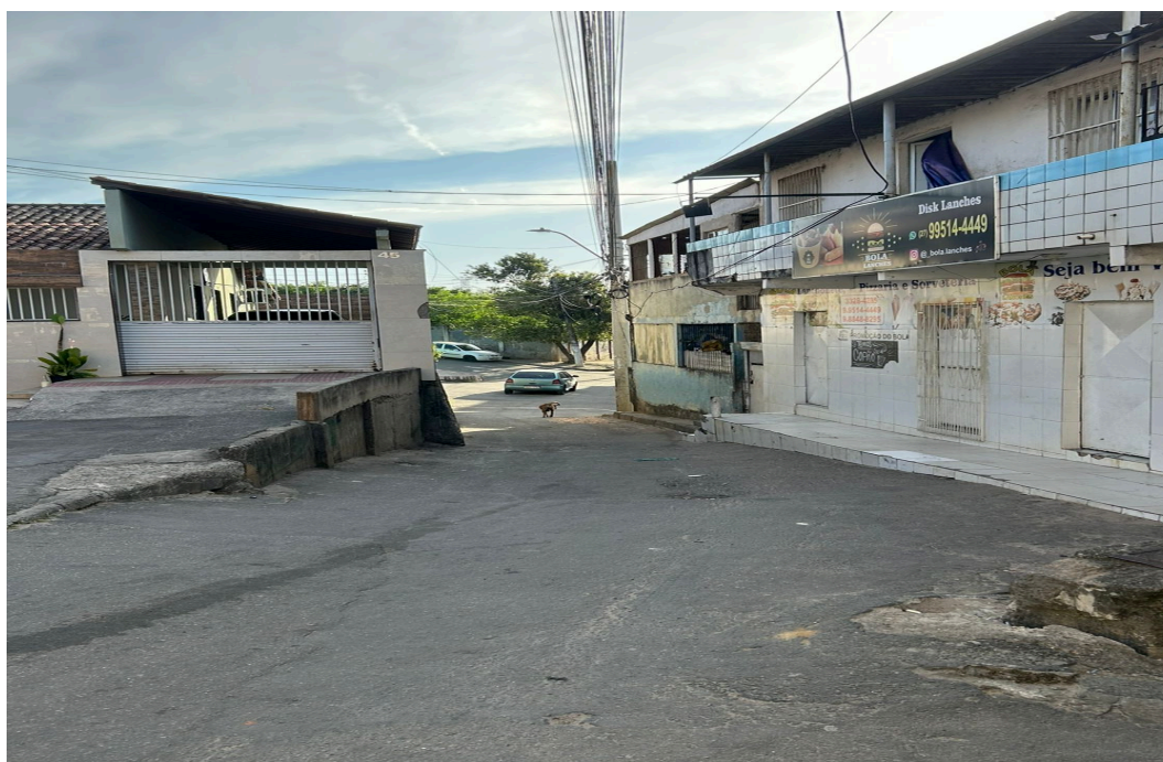
Imagem 2 - Vista da Rua da Alegria, S/N, Jardim Tropical, Serra - ES

Rua Major Pissarra, 245 - Centro – Serra - ES – CEP: 29.176-020 – TEL (27) 3251-8300 E-mail: gabinetegeorge@camaraserra.es.gov.br / Site: www.camaraserra.es.gov.br