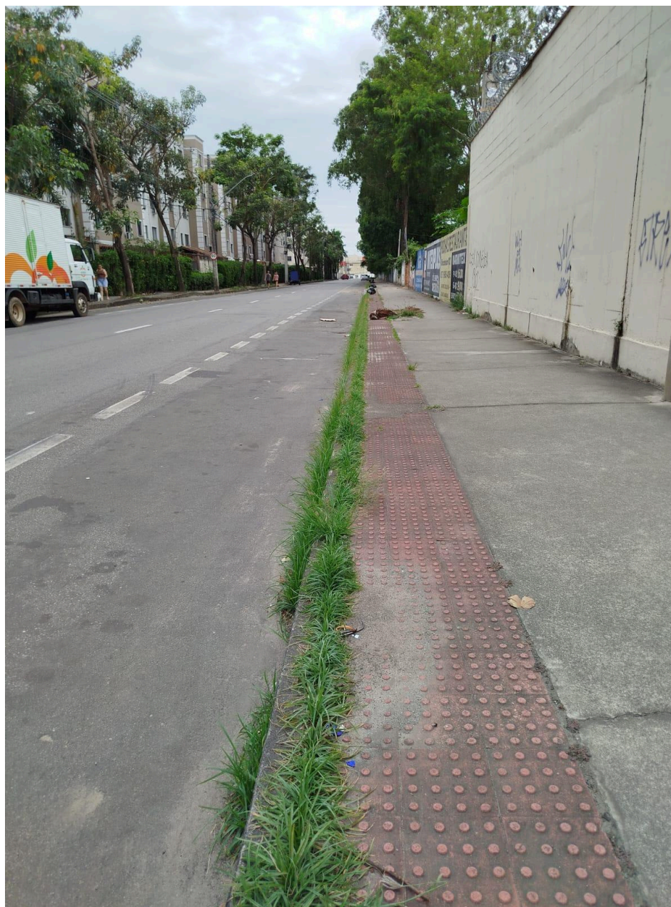
Imagem 2 - Vista da Rua Barão do Rio Branco, S/N, Colina de Laranjeiras, Serra - ES.

Rua Major Pissarra, 245 - Centro – Serra - ES – CEP: 29.176-020 – TEL (27) 3251-8300 E-mail: gabinetegeorge@camaraserra.es.gov.br / Site: www.camaraserra.es.gov.br