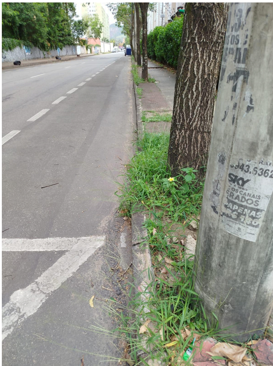
Imagem 3 - Vista da Rua Barão do Rio Branco, S/N, Colina de Laranjeiras, Serra - ES.

Rua Major Pissarra, 245 - Centro – Serra - ES – CEP: 29.176-020 – TEL (27) 3251-8300 E-mail: gabinetegeorge@camaraserra.es.gov.br / Site: www.camaraserra.es.gov.br