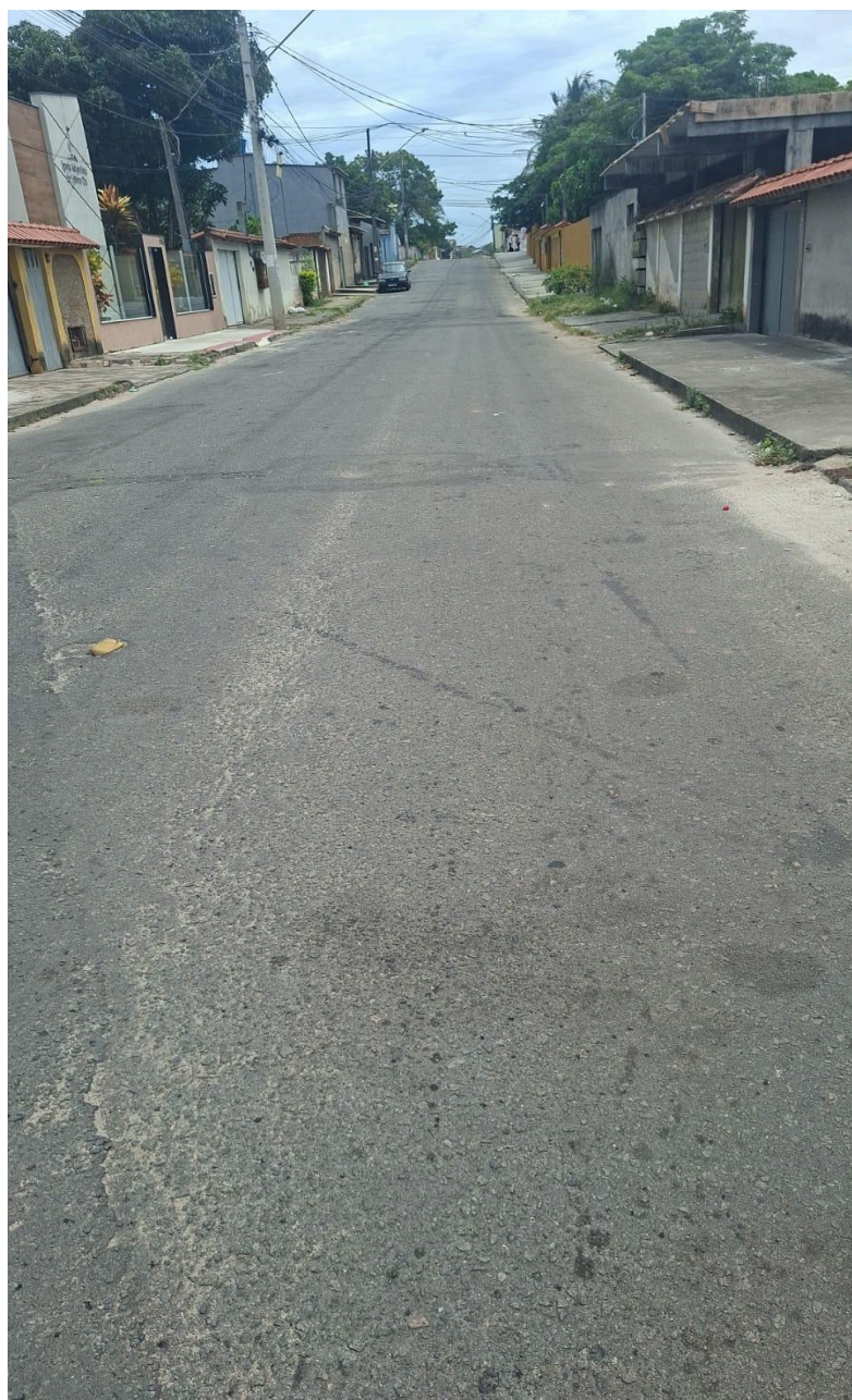
Imagem 3 - Vista da Rua São Lucas, SN, esquina com a Rua Guaicurus, das Laranjeiras, Serra - ES.

Rua Major Pissarra, 245 - Centro – Serra - ES – CEP: 29.176-020 – TEL (27) 3251-8300 E-mail: gabinetegeorge@camaraserra.es.gov.br / Site: www.camaraserra.es.gov.br