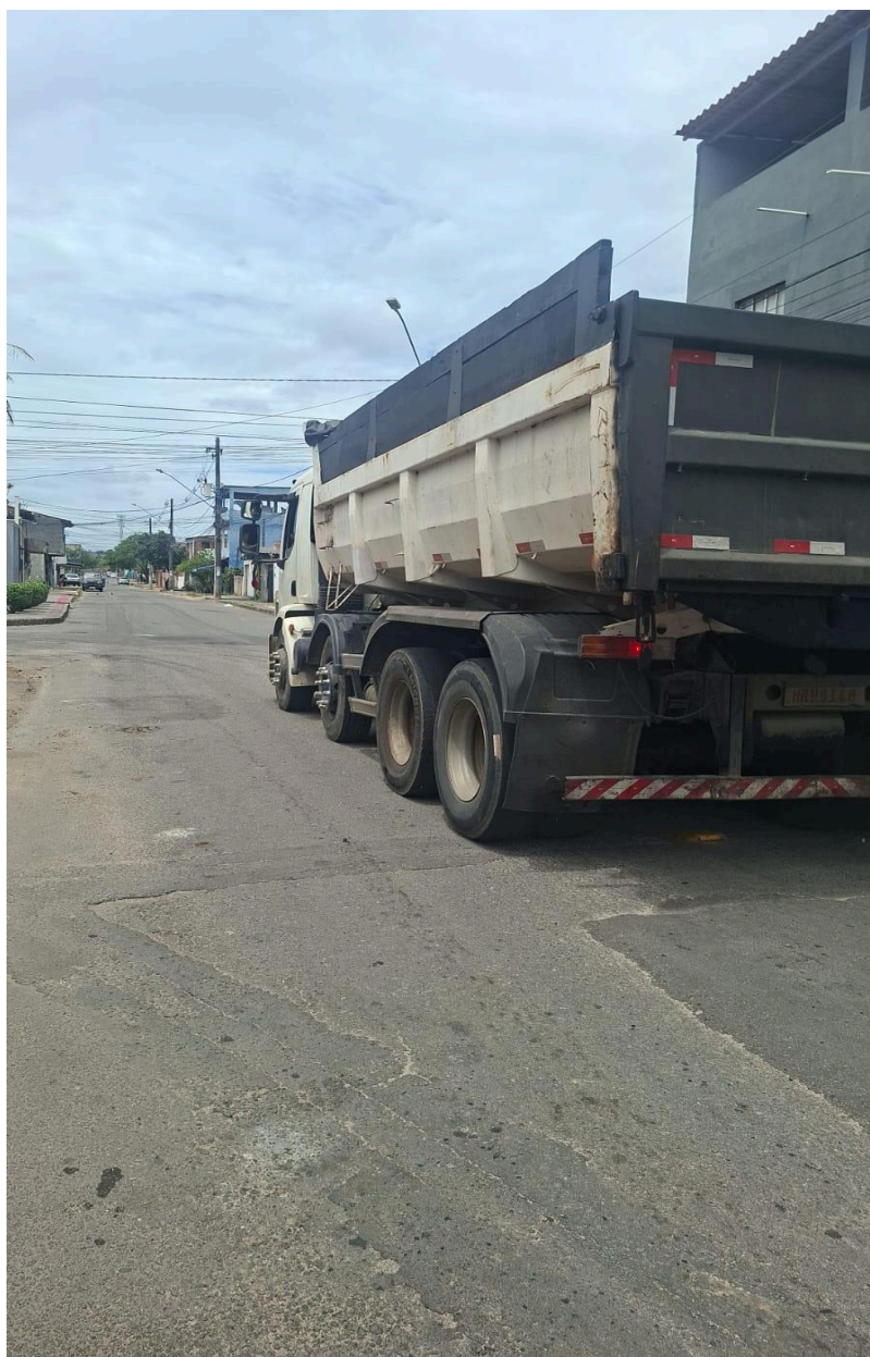
Imagem 2 - Vista da Rua São Lucas, SN, esquina com a Rua Guaicurus, das Laranjeiras, Serra - ES.

Rua Major Pissarra, 245 - Centro – Serra - ES – CEP: 29.176-020 – TEL (27) 3251-8300 E-mail: gabinetegeorge@camaraserra.es.gov.br / Site: www.camaraserra.es.gov.br