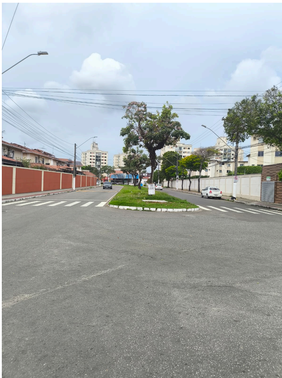
Imagem 2 - Vista da Avenida Copacabana s/n Morada de Laranjeiras, Serra/ES.

Rua Major Pissarra, 245 - Centro - Serra - ES – CEP: 29.176-020 – TEL (27) 3251-8300 E-mail: gabinetegeorge@camaraserra.es.gov.br / Site: www.camaraserra.es.gov.br