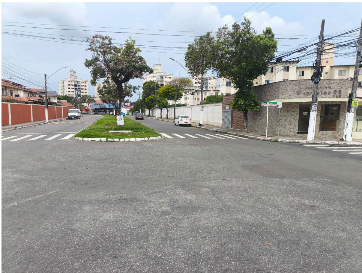
Imagem 3 - Vista da Avenida Copacabana s/n Morada de Laranjeiras, Serra/ES.

Rua Major Pissarra, 245 - Centro - Serra - ES – CEP: 29.176-020 – TEL (27) 3251-8300 E-mail: gabinetegeorge@camaraserra.es.gov.br / Site: www.camaraserra.es.gov.br