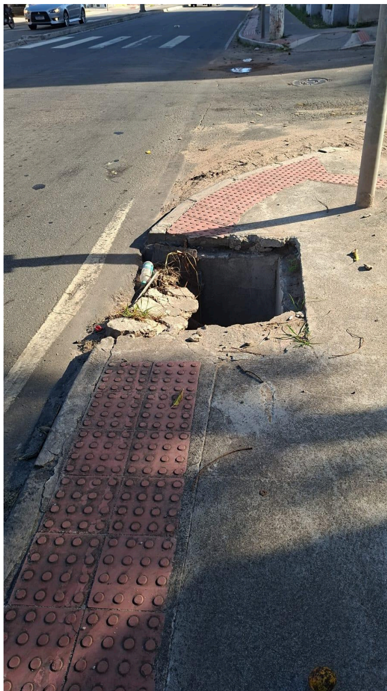
Imagem 3 - Avenida Abido Saadi, nº 949, Parque Jacaraípe, Serra - ES.

Rua Major Pissarra, 245 - Centro – Serra - ES – CEP: 29.176-020 – TEL (27) 3251-8300 E-mail: gabinetegeorge@camaraserra.es.gov.br / Site: www.camaraserra.es.gov.br