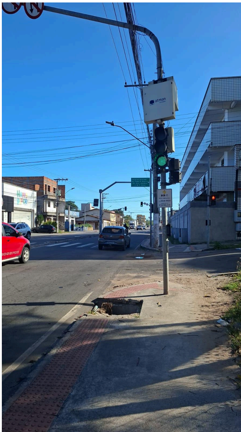
Imagem 4 - Avenida Abido Saadi, nº 949, Parque Jacaraípe, Serra - ES.

Rua Major Pissarra, 245 - Centro – Serra - ES – CEP: 29.176-020 – TEL (27) 3251-8300 E-mail: gabinetegeorge@camaraserra.es.gov.br / Site: www.camaraserra.es.gov.br