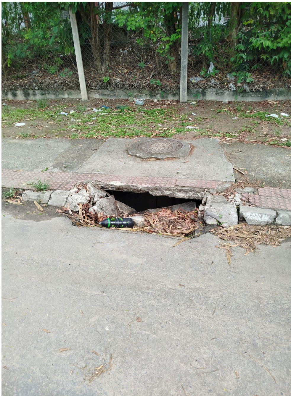
Imagem 3 - Vista da Avenida Iriri, S/N, Valparaíso, Serra - ES.

Rua Major Pissarra, 245, Centro – Serra/ES – CEP: 29.176-020 – TEL (27) 3251-8300 E-mail: gabinetegeorge@camaraserra.es.gov.br / Site: www.camara.serra.es.gov.br