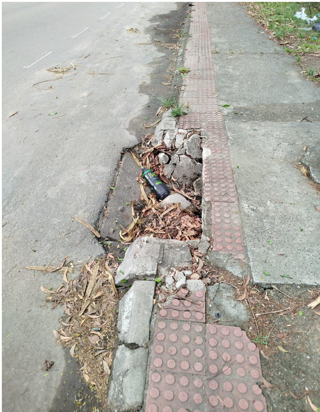
Imagem 2 - Vista da Avenida Iriri, S/N, Valparaíso, Serra - ES.

Rua Major Pissarra, 245, Centro – Serra/ES – CEP: 29.176-020 – TEL (27) 3251-8300 E-mail: gabinetegeorge@camaraserra.es.gov.br / Site: www.camara.serra.es.gov.br