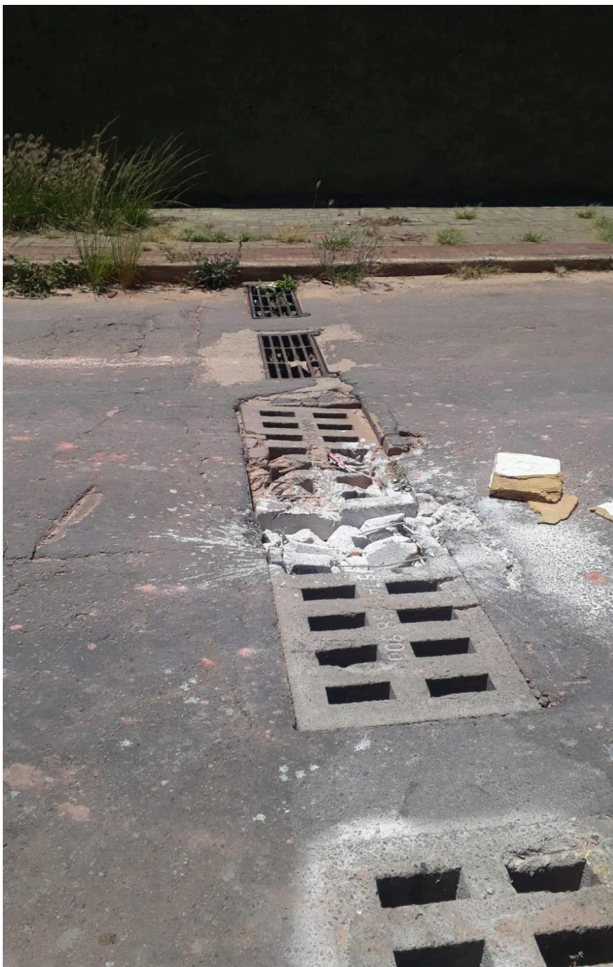
Imagem 2 - Vista da Rua Raimundo Correa, Nº 295, Chácara Parreiral, Serra - ES.

Rua Major Pissarra, 245 - CENTRO – SERRA - ES – CEP: 29.176-020 – TEL (27) 3251-8300 E-mail: gabinetegeorge@camaraserra.es.gov.br / Site: www.camara.serra.es.gov.br