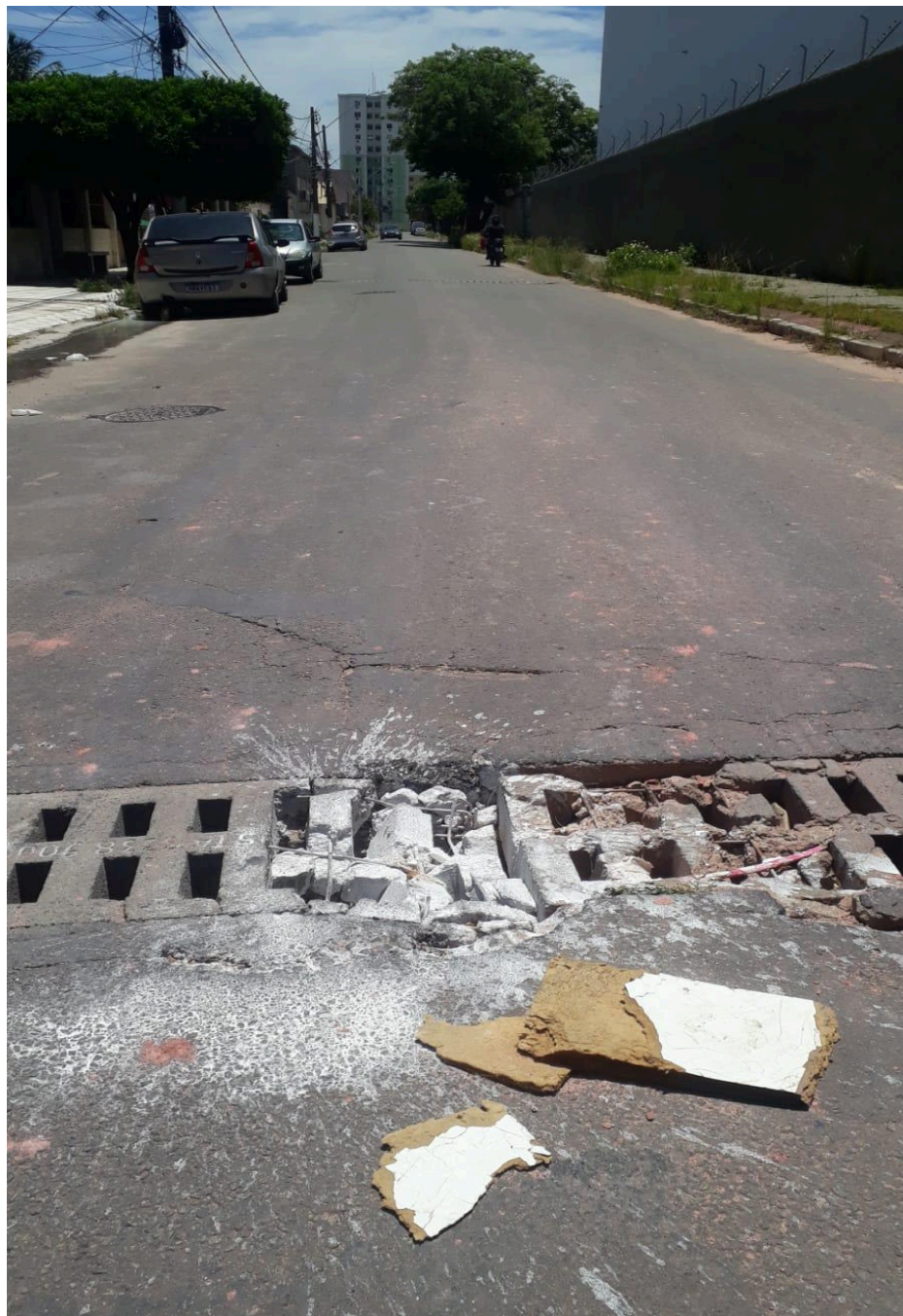
Imagem 3 - Vista da Rua Raimundo Correa, Nº 295, Chácara Parreiral, Serra - ES.

Rua Major Pissarra, 245 - CENTRO – SERRA - ES – CEP: 29.176-020 – TEL (27) 3251-8300 E-mail: gabinetegeorge@camaraserra.es.gov.br / Site: www.camara.serra.es.gov.br