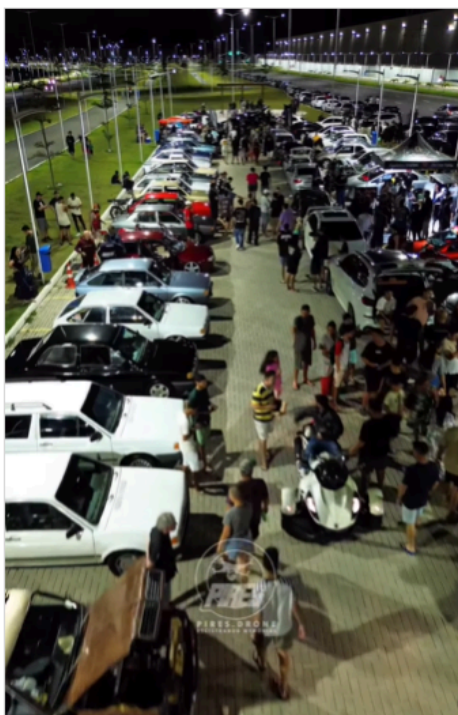
Imagem 2 – Foto do evento semanal realizado no Parque Linear Civit I.

Rua Major Pissarra, 245 - Centro – Serra - ES – CEP: 29.176-020 – TEL (27) 3251-8300 E-mail: gabinetegeorge@camaraserra.es.gov.br / Site: www.camaraserra.es.gov.br