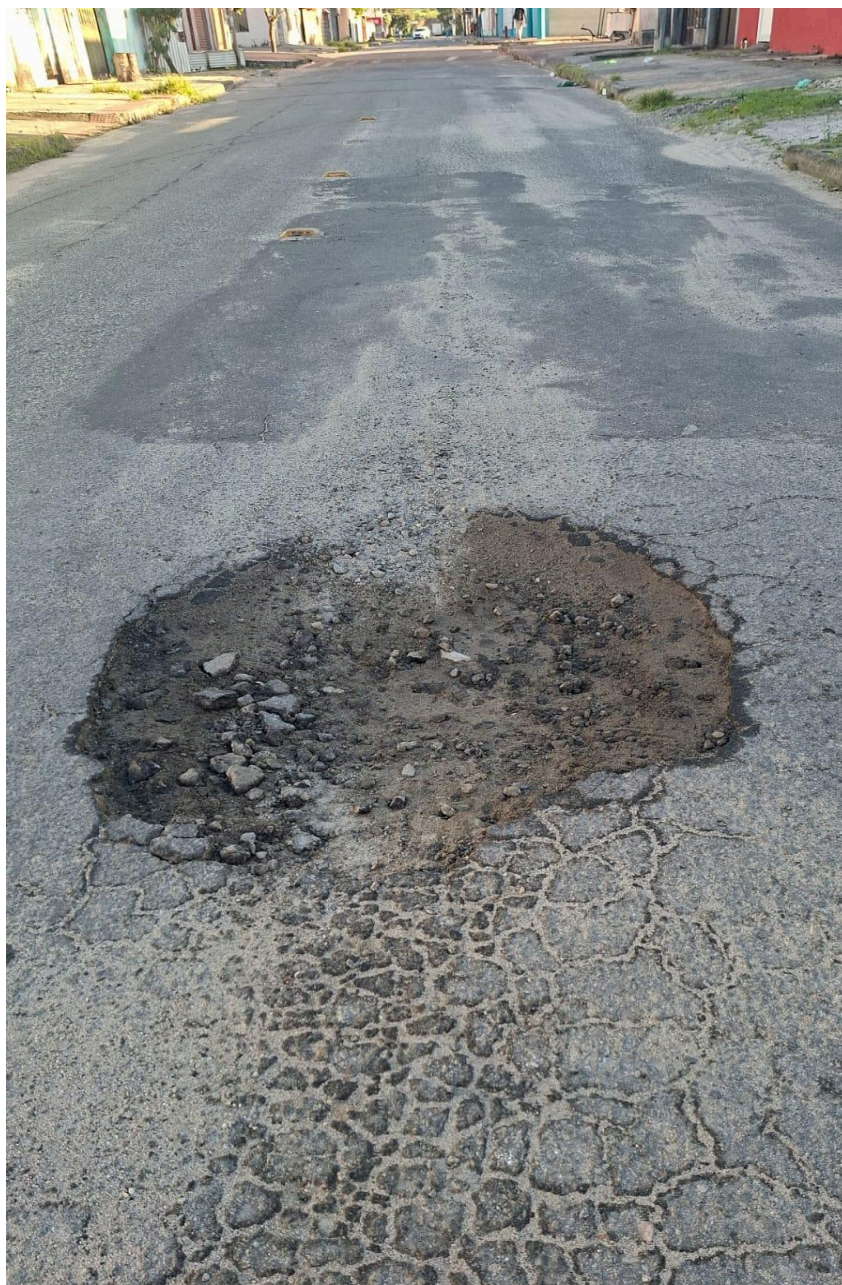
Imagem 3 - Vista da Rua São Lucas, Nº 394, Das Laranjeiras, Serra - ES.

Rua Major Pissarra, 245 - Centro – Serra/ES – CEP: 29.176-020. Tel.: (27) 3251-8300 E-mail: gabinetegeorge@camaraserra.es.gov.br / Site: www.camara.serra.es.gov.br