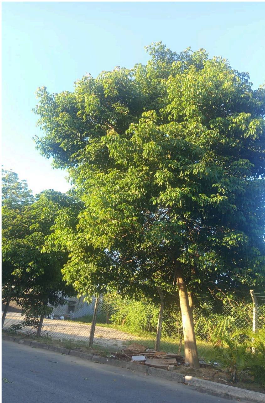
Imagem 2 - Vista da Rua Ana Maria, S/N, Colina de Laranjeiras, Serra - ES.

Rua Major Pissarra, 245 - Centro – Serra - ES – CEP: 29.176-020 – TEL (27) 3251-8300 E-mail: gabinetegeorge@camaraserra.es.gov.br / Site: www.camaraserra.es.gov.br