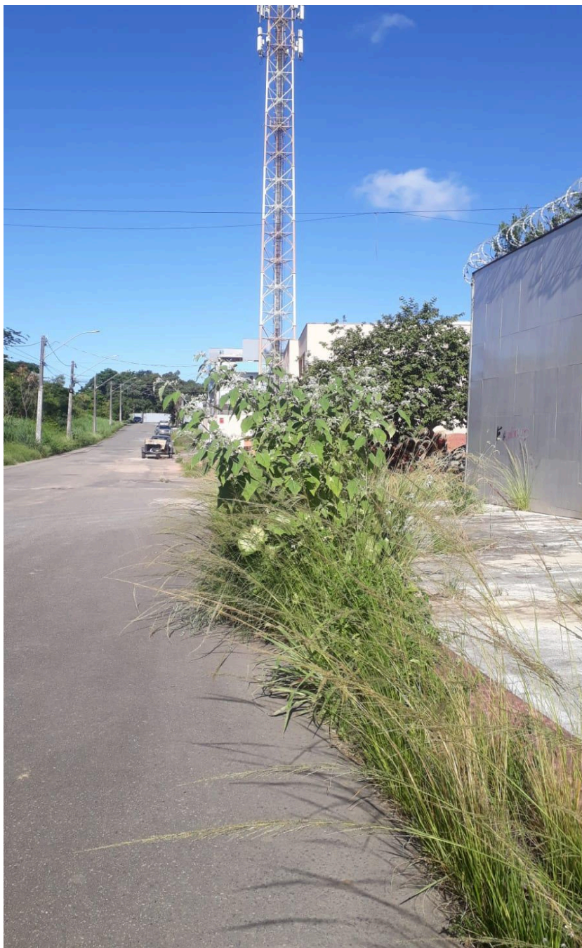
Imagem 3 - Vista da Avenida Macanaíba, S/N , Colina de Laranjeiras, Serra - ES.

Rua Major Pissarra, 245 - Centro – Serra - ES – CEP: 29.176-020 – TEL (27) 3251-8300 E-mail: gabinetegeorge@camaraserra.es.gov.br / Site: www.camaraserra.es.gov.br