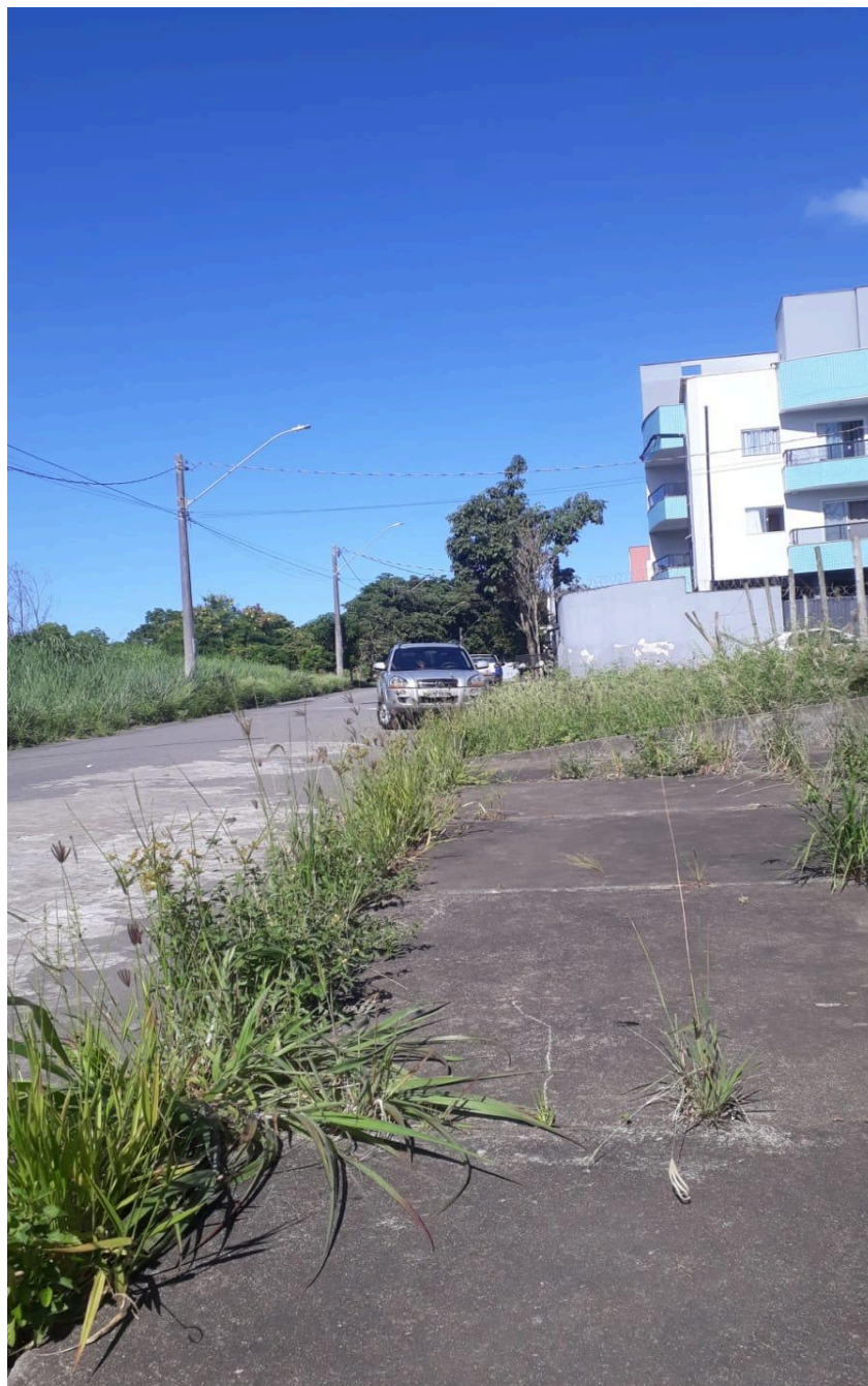
Imagem 2 - Vista da Avenida Macanaíba, S/N, Colina de Laranjeiras, Serra - ES.

Rua Major Pissarra, 245 - Centro – Serra - ES – CEP: 29.176-020 – TEL (27) 3251-8300 E-mail: gabinetegeorge@camaraserra.es.gov.br / Site: www.camaraserra.es.gov.br