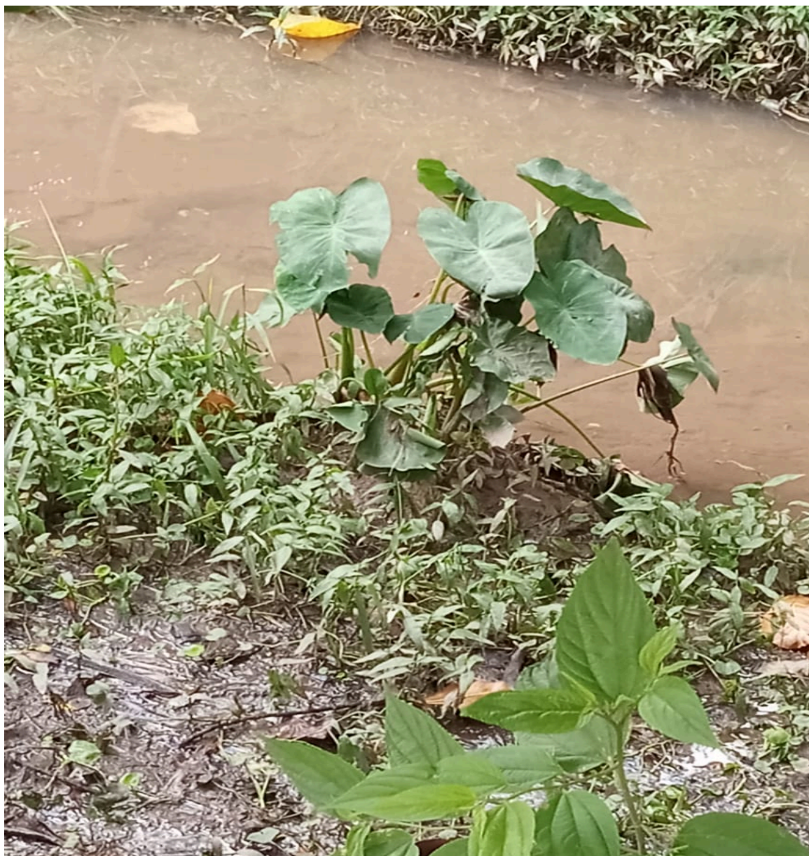
Imagem 2 - Vista do Valão, Rua Gonçalves Dias, s/n, Jardim Limoeiro, Serra/ES.

Rua Major Pissarra, 245 - Centro – Serra - ES – CEP: 29.176-020 – TEL (27) 3251-8300 E-mail: gabinetegeorge@camaraserra.es.gov.br / Site: www.camaraserra.es.gov.br