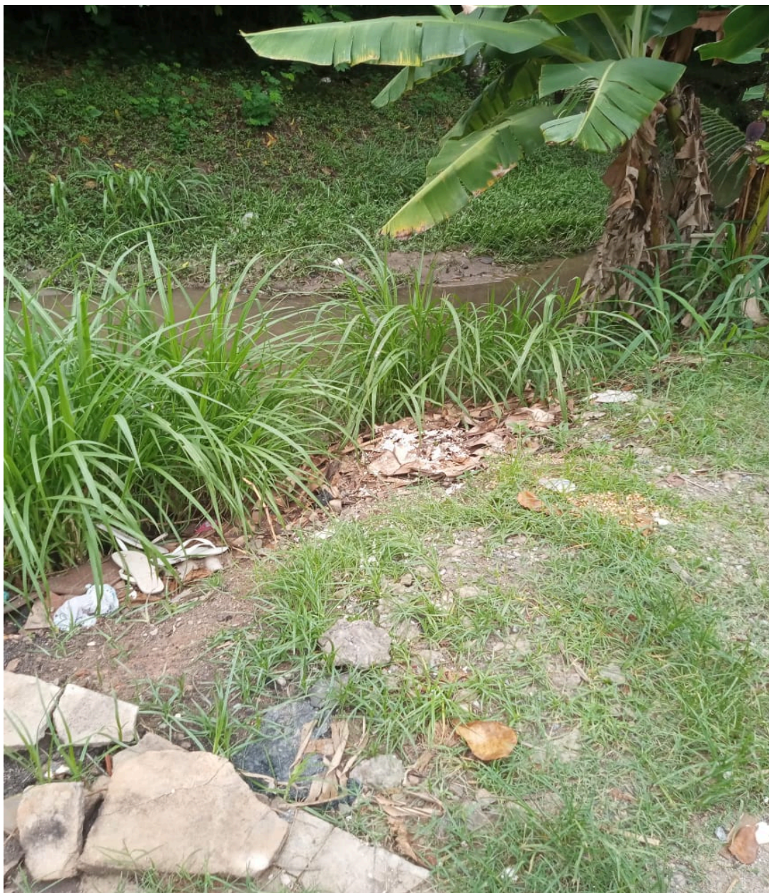
Imagem 3 - Vista do Valão, Rua Gonçalves Dias, s/n, Jardim Limoeiro, Serra/ES.

Rua Major Pissarra, 245 - Centro – Serra - ES – CEP: 29.176-020 – TEL (27) 3251-8300 E-mail: gabinetegeorge@camaraserra.es.gov.br / Site: www.camaraserra.es.gov.br