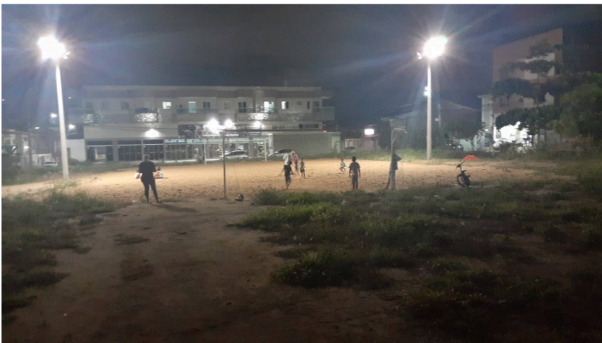
Imagem 2 – Vista do Campo de Areia, na Rua Imbirema, s/n, Colina de Laranjeiras.

Rua Major Pissarra, 245 - Centro – Serra - ES – CEP: 29.176-020 – TEL (27) 3251-8300 E-mail: gabinetegeorge@camaraserra.es.gov.br / Site: www.camaraserra.es.gov.br