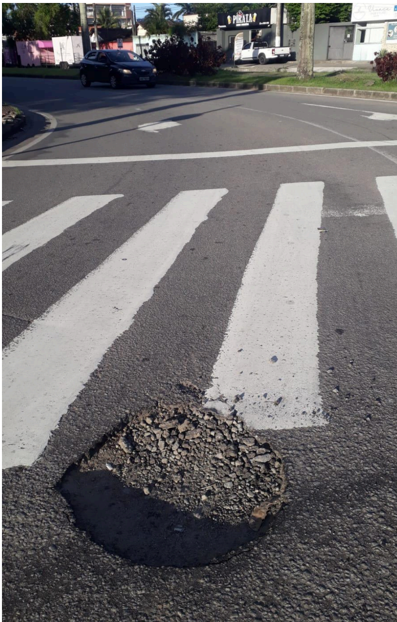
Imagem 3 - Vista da Avenida Brauna, s/n, Colina de Laranjeiras, Serra - ES.

Rua Major Pissarra, 245 - Centro – Serra - ES – CEP: 29.176-020 – TEL (27) 3251-8300 E-mail: gabinetegeorge@camaraserra.es.gov.br / Site: www.camaraserra.es.gov.br