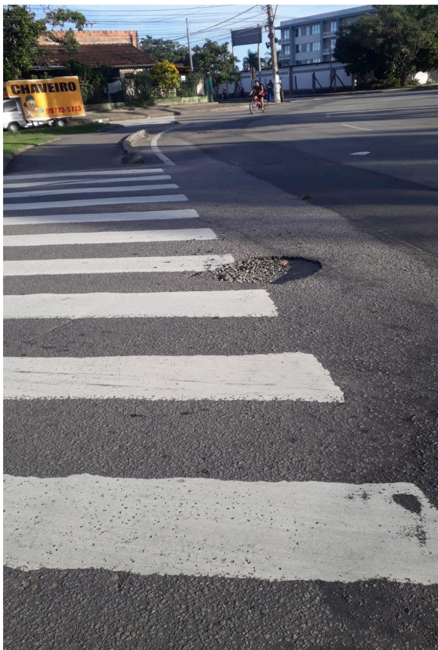
Imagem 2 - Vista da Avenida Brauna, s/n, Colina de Laranjeiras, Serra - ES.

Rua Major Pissarra, 245 - Centro – Serra - ES – CEP: 29.176-020 – TEL (27) 3251-8300 E-mail: gabinetegeorge@camaraserra.es.gov.br / Site: www.camaraserra.es.gov.br