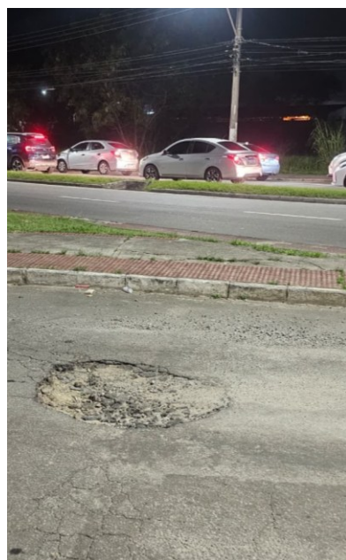
Rua Rachel Vitalino