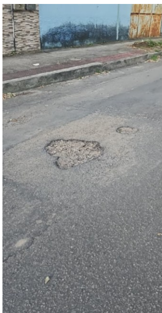
Rua Eduardo Xible