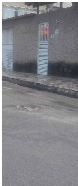
Rua Rio Guaporé