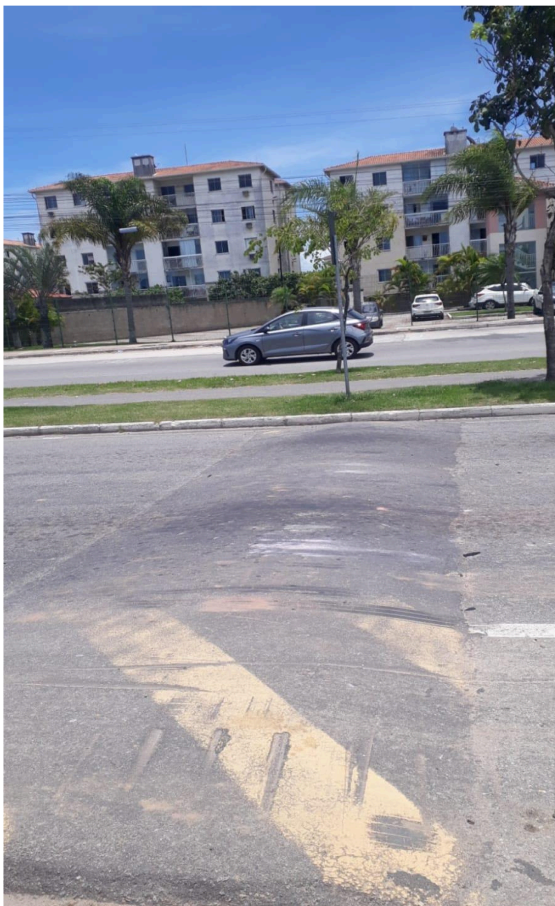
Imagem 3 - Vista da Av. Desembargador Antonio José Miguel Feu Rosa, s/n, Praia da Baleia, Serra - ES.

Rua Major Pissarra, 245 - Centro – Serra - ES – CEP: 29.176-020 – TEL (27) 3251-8300 E-mail: gabinetegeorge@camaraserra.es.gov.br / Site: www.camaraserra.es.gov.br