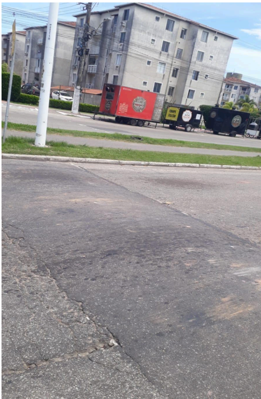
Imagem 2 - Vista da Av. Desembargador Antonio José Miguel Feu Rosa, s/n, Praia da Baleia, Serra - ES.

Rua Major Pissarra, 245 - Centro – Serra - ES – CEP: 29.176-020 – TEL (27) 3251-8300 E-mail: gabinetegeorge@camaraserra.es.gov.br / Site: www.camaraserra.es.gov.br