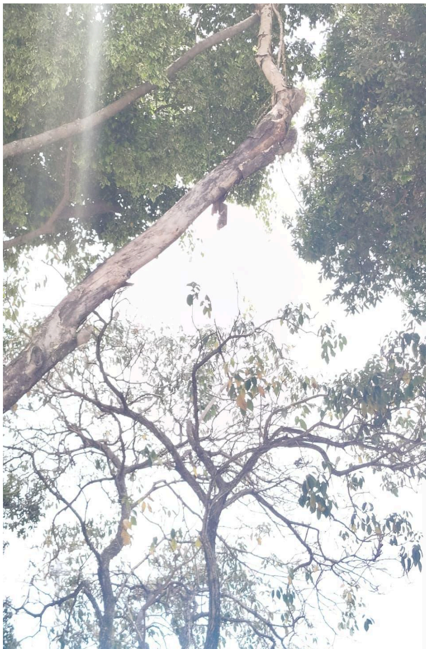
Imagem 3 – Vista da Av. Mestre Álvaro, s/n, Colina de Laranjeiras, Serra - ES.

Rua Major Pissarra, 245 - Centro – Serra - ES – CEP: 29.176-020 – TEL (27) 3251-8300 E-mail: gabinetegeorge@camaraserra.es.gov.br / Site: www.camaraserra.es.gov.br