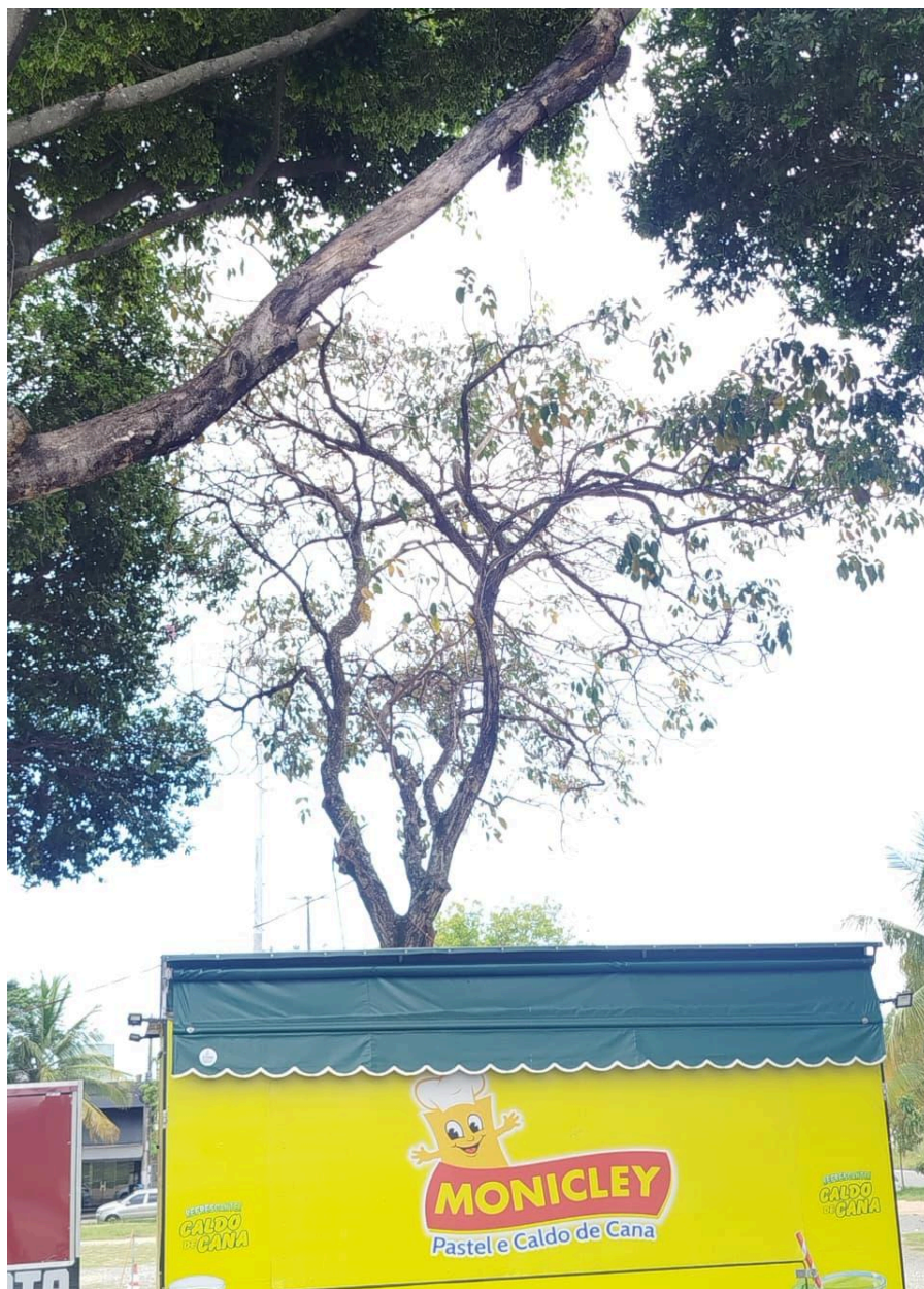
Imagem 2 – Vista da Av. Mestre Álvaro, s/n, Colina de Laranjeiras, Serra - ES.

Rua Major Pissarra, 245 - Centro – Serra - ES – CEP: 29.176-020 – TEL (27) 3251-8300 E-mail: gabinetegeorge@camaraserra.es.gov.br / Site: www.camaraserra.es.gov.br