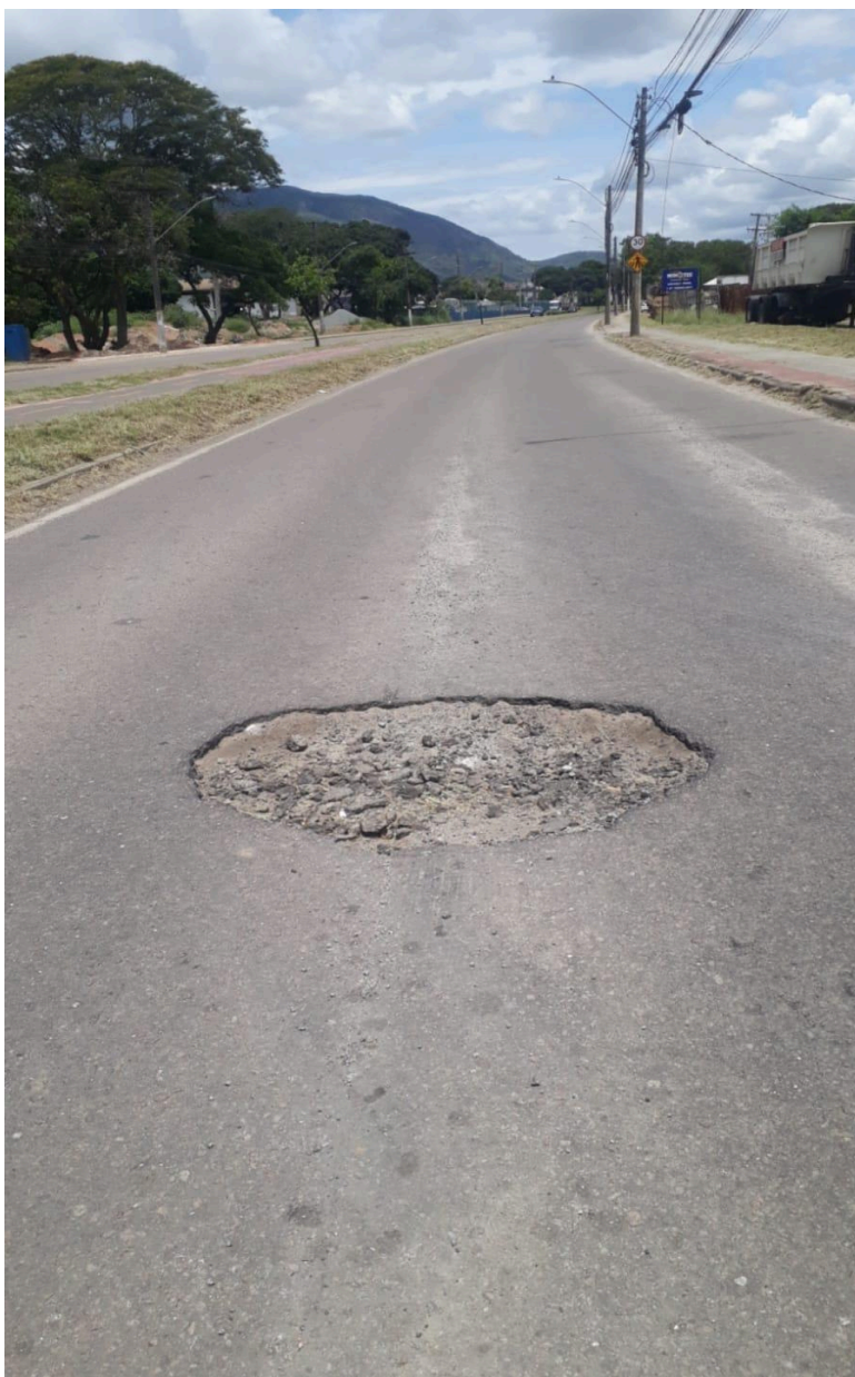
Imagem 3 - Vista da Avenida Paulo Miguel Bohomoletz, nº 1000, Civit I, Serra - ES.

Rua Major Pissarra, 245 - Centro – Serra - ES – Cep: 29.176-020 – Tel: (27) 3251-8300 E-mail: gabinetegeorge@camaraserra.es.gov.br / Site: www.camaraserra.es.gov.br