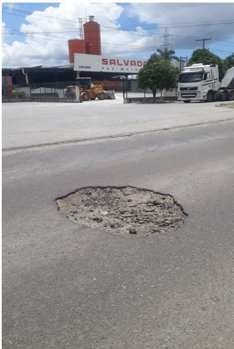
Imagem 2 - Vista da Avenida Paulo Miguel Bohomoletz, nº 1000, Civit I, Serra - ES.

Rua Major Pissarra, 245 - Centro – Serra - ES – Cep: 29.176-020 – Tel: (27) 3251-8300 E-mail: gabinetegeorge@camaraserra.es.gov.br / Site: www.camaraserra.es.gov.br