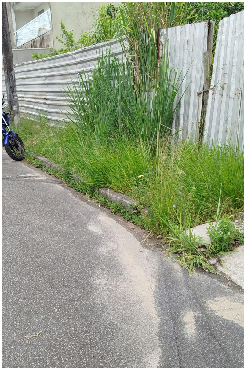
Imagem 3 - Vista da Rua Monte Pascoal, S/N, Colina de Laranjeiras, Serra - ES.

Rua Major Pissarra, 245 - Centro – Serra - ES – Cep: 29.176-020 – Tel: (27) 3251-8300 E-mail: gabinetegeorge@camaraserra.es.gov.br / Site: www.camaraserra.es.gov.br