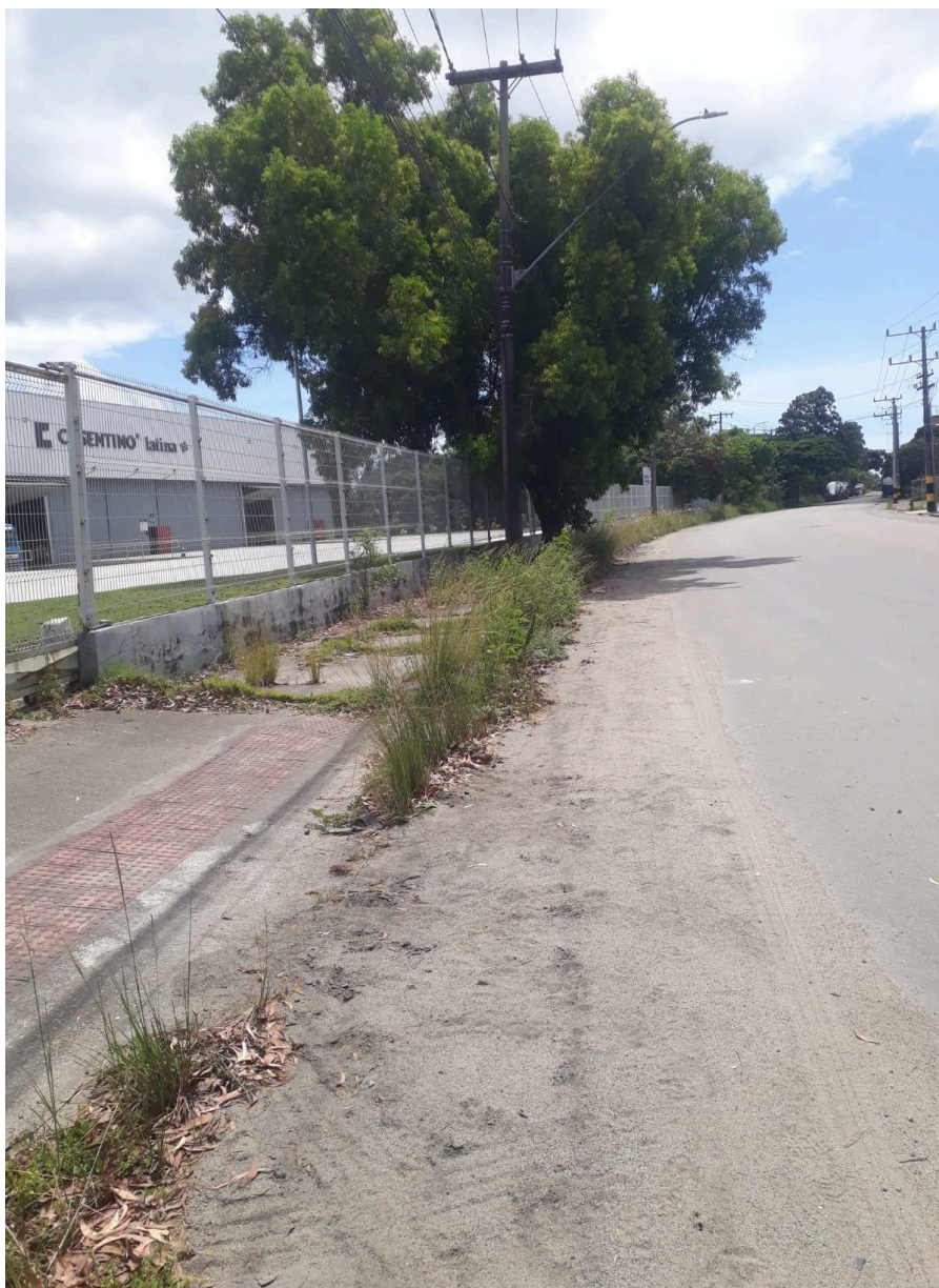
Imagem 2 - Vista da Rua E, nº 1075, QD XI, CIVIT I, Serra - ES.

Rua Major Pissarra, 245 - Centro – Serra - ES – Cep: 29.176-020 – Tel: (27) 3251-8300 E-mail: gabinetegeorge@camaraserra.es.gov.br / Site: www.camaraserra.es.gov.br