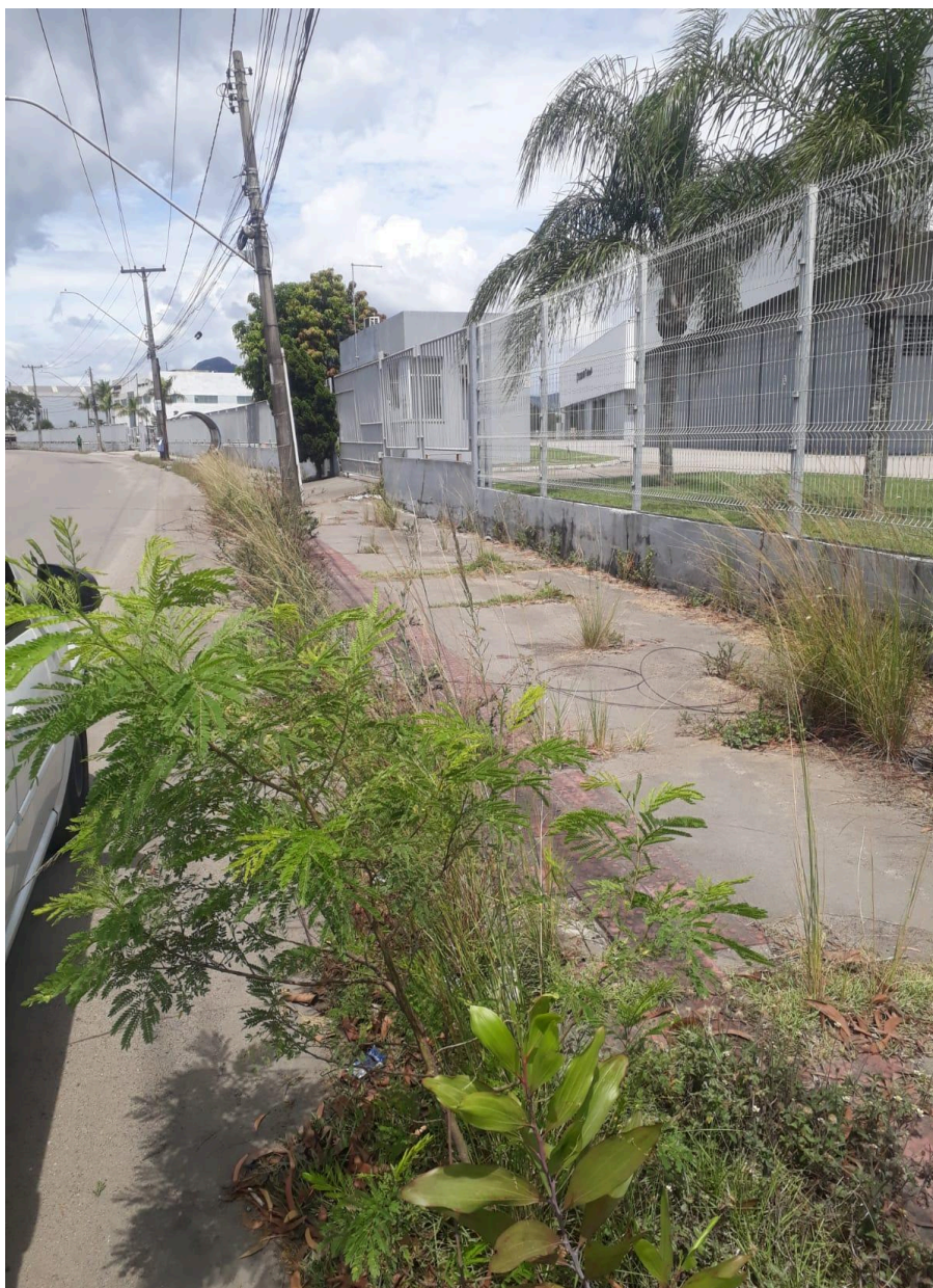
Imagem 3 - Vista da Rua E, nº 1075, QD XI, CIVIT I, Serra - ES.

Rua Major Pissarra, 245 - Centro – Serra - ES – Cep: 29.176-020 – Tel: (27) 3251-8300 E-mail: gabinetegeorge@camaraserra.es.gov.br / Site: www.camaraserra.es.gov.br