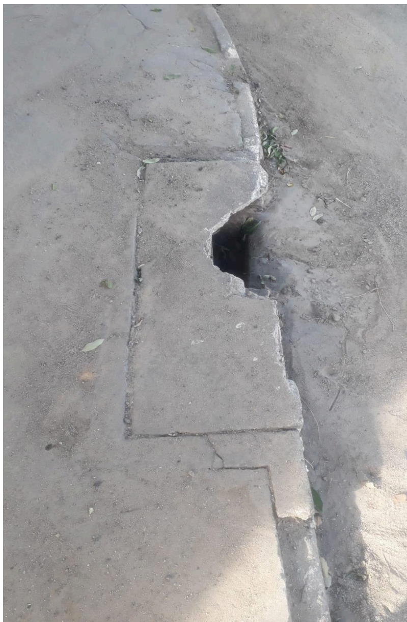
Imagem 2 - Vista da Rua Gustavo Barroso, nº 215, Chácara Parreiral, Serra - ES.

Rua Major Pissarra, 245 - Centro – Serra/ES – CEP: 29.176-020. Tel.: (27) 3251-8300 E-mail: gabinetegeorge@camaraserra.es.gov.br / Site: www.camaraserra.es.gov.br