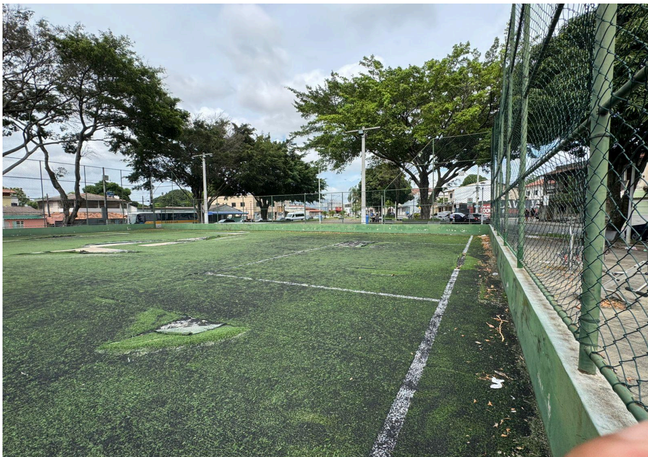
Imagem 2 - Vista da Praça na Rua Miguel Ângelo, S/N, Parque Res. Laranjeiras, Serra - ES.

Rua Major Pissarra, 245 - Centro – Serra - ES – CEP: 29.176-020 – TEL (27) 3251-8300 E-mail: vereadorgeorge@camaraserra.es.gov.br / Site: www.camaraserra.es.gov.br