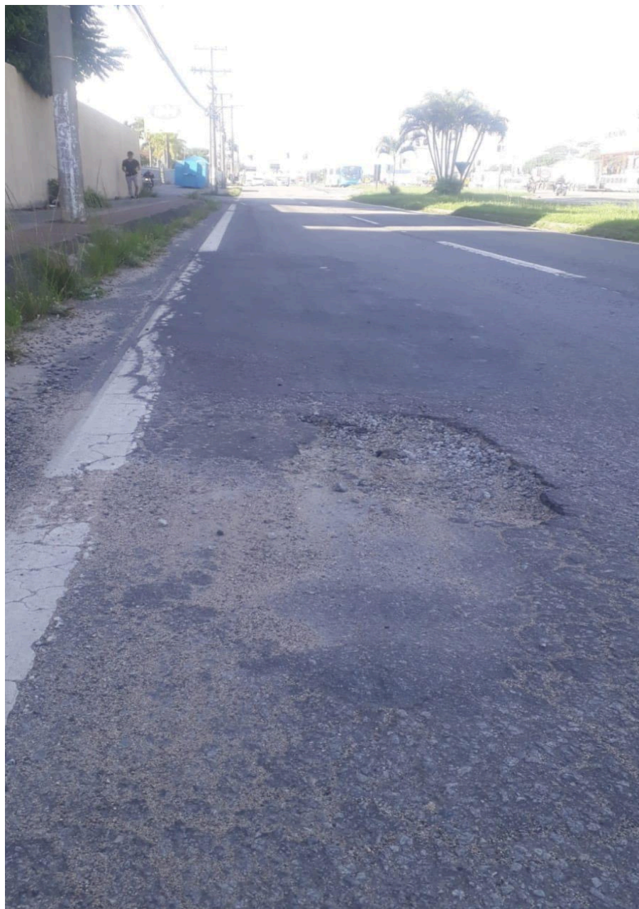
Imagem 3 - Vista do buraco, Av. Mestre Álvaro, S/N, Colina de Laranjeiras, Serra - ES. Fonte: Gabinete.

Rua Major Pissarra, 245 - Centro – Serra - ES – CEP: 29.176-020 – TEL (27) 3251-8300 E-mail: gabinetegeorge@camaraserra.es.gov.br / Site: www.camaraserra.es.gov.br