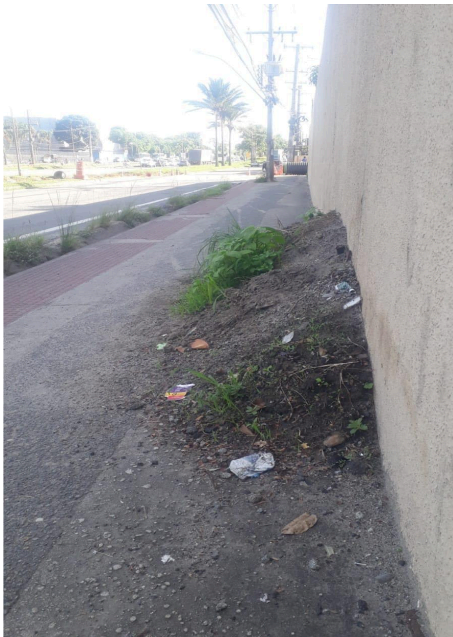
Imagem 2 - Vista da Avenida Mestre Álvaro, S/N, Colina de Laranjeiras, Serra - ES.

Rua Major Pissarra, 245 - Centro – Serra - ES – CEP: 29.176-020 – TEL (27) 3251-8300 E-mail: gabinetegeorge@camaraserra.es.gov.br / Site: www.camaraserra.es.gov.br