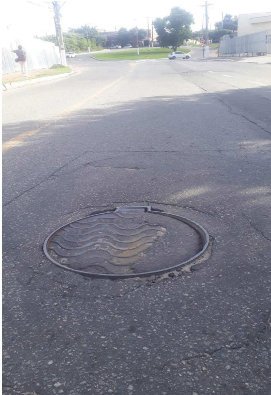
Imagem 2 - Vista da tampa na Rua 5D, s/n, Colina de Laranjeiras, Serra - ES.

Rua Major Pissarra, 245, Centro – Serra/ES – Cep: 29.176-020 – Tel: (27) 3251-8300 E-mail: gabinetegeorge@camaraserra.es.gov.br / Site: www.camara.serra.es.gov.br