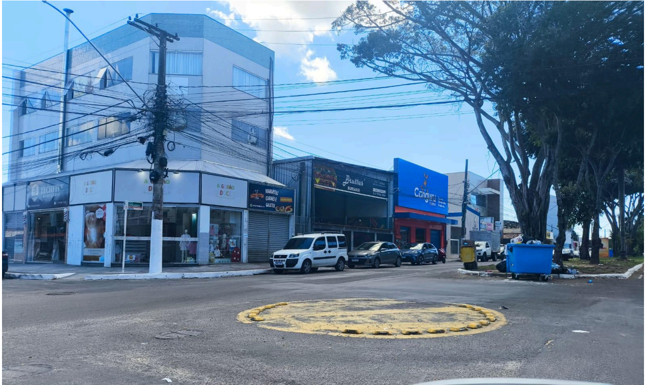
Imagem 2 - Vista da Av. Copacabana, com a Rua Ipanema, s/n, Morada de Laranjeiras, Serra - ES.

Rua Major Pissarra, 245 - Centro – Serra/ ES – CEP: 29.176-020 – TEL (27) 3251-8300 E-mail: gabinetegeorge@camaraserra.es.gov.br / Site: www.camaraserra.es.gov.br