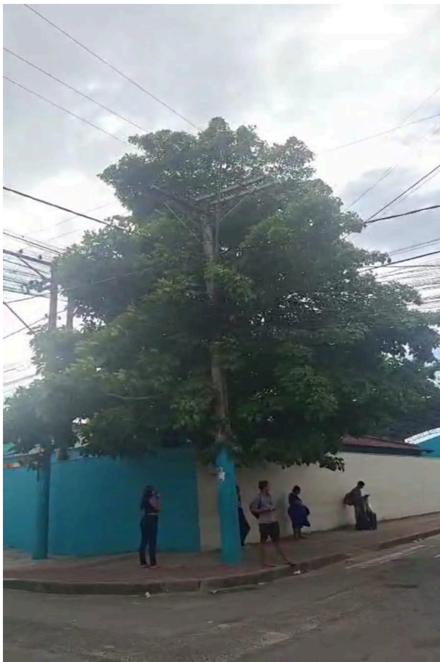
Imagem 2 - Vista da Rua Goitacazes, s/n, Das Laranjeiras, Serra - ES.

Rua Major Pissarra, 245 - Centro – Serra - ES – CEP: 29.176-020 – TEL (27) 3251-8300 E-mail: gabinetegeorge@camaraserra.es.gov.br / Site: www.camaraserra.es.gov.br