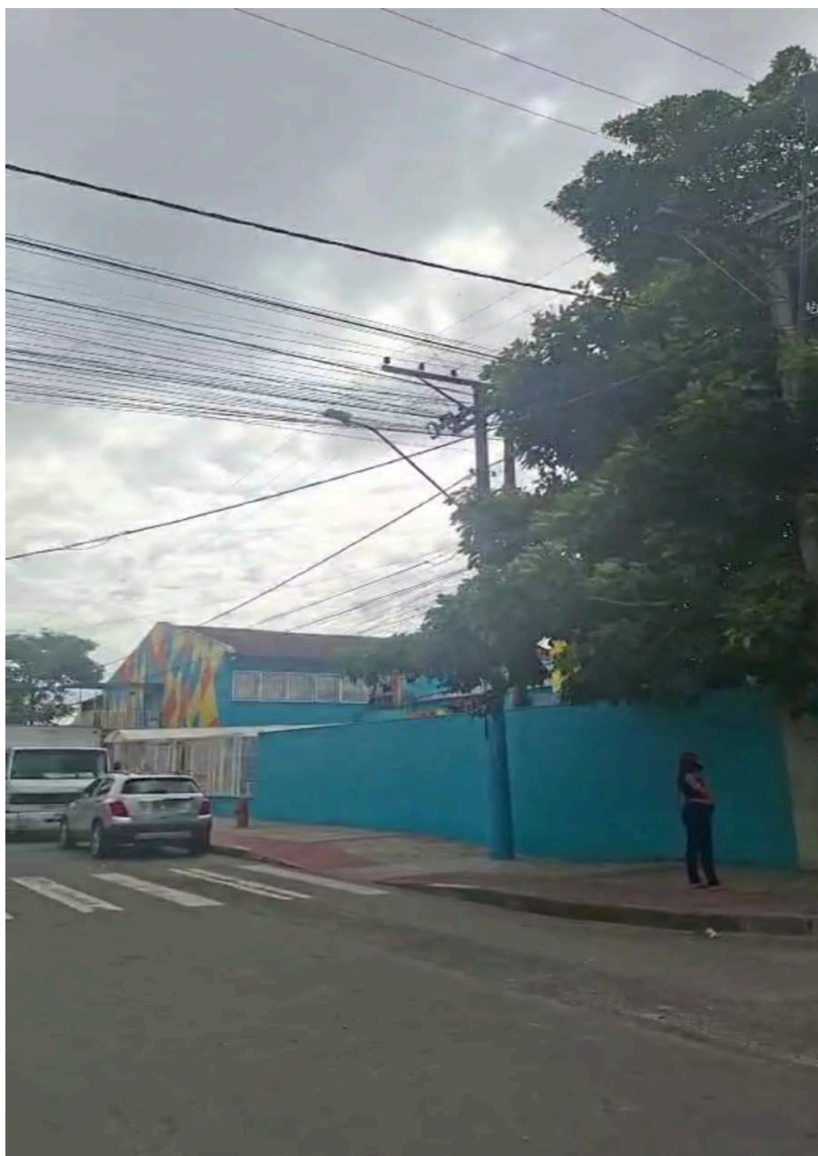
Imagem 3 - Vista da Rua Goitacazes, s/n, Das Laranjeiras, Serra - ES.

Rua Major Pissarra, 245 - Centro – Serra - ES – CEP: 29.176-020 – TEL (27) 3251-8300 E-mail: gabinetegeorge@camaraserra.es.gov.br / Site: www.camaraserra.es.gov.br