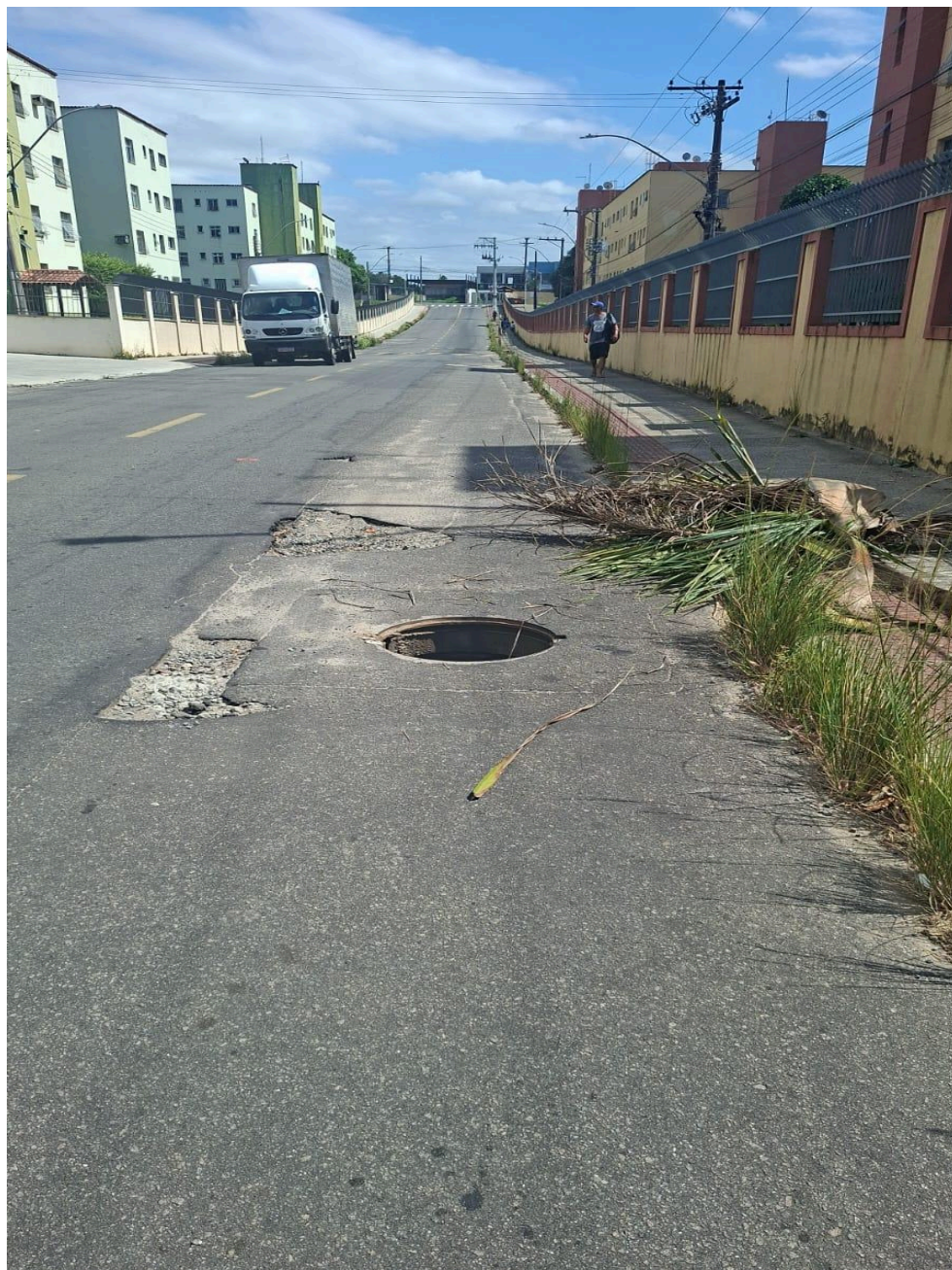
Imagem 2 - Vista da da Rua D, Quadra 08, Castelândia, Serra - ES.

Rua Major Pissarra, 245 - Centro – Serra - ES – Cep: 29.176-020 – Tel (27) 3251-8300 E-mail: gabinetegeorge@camaraserra.es.gov.br / Site: www.camaraserra.es.gov.br