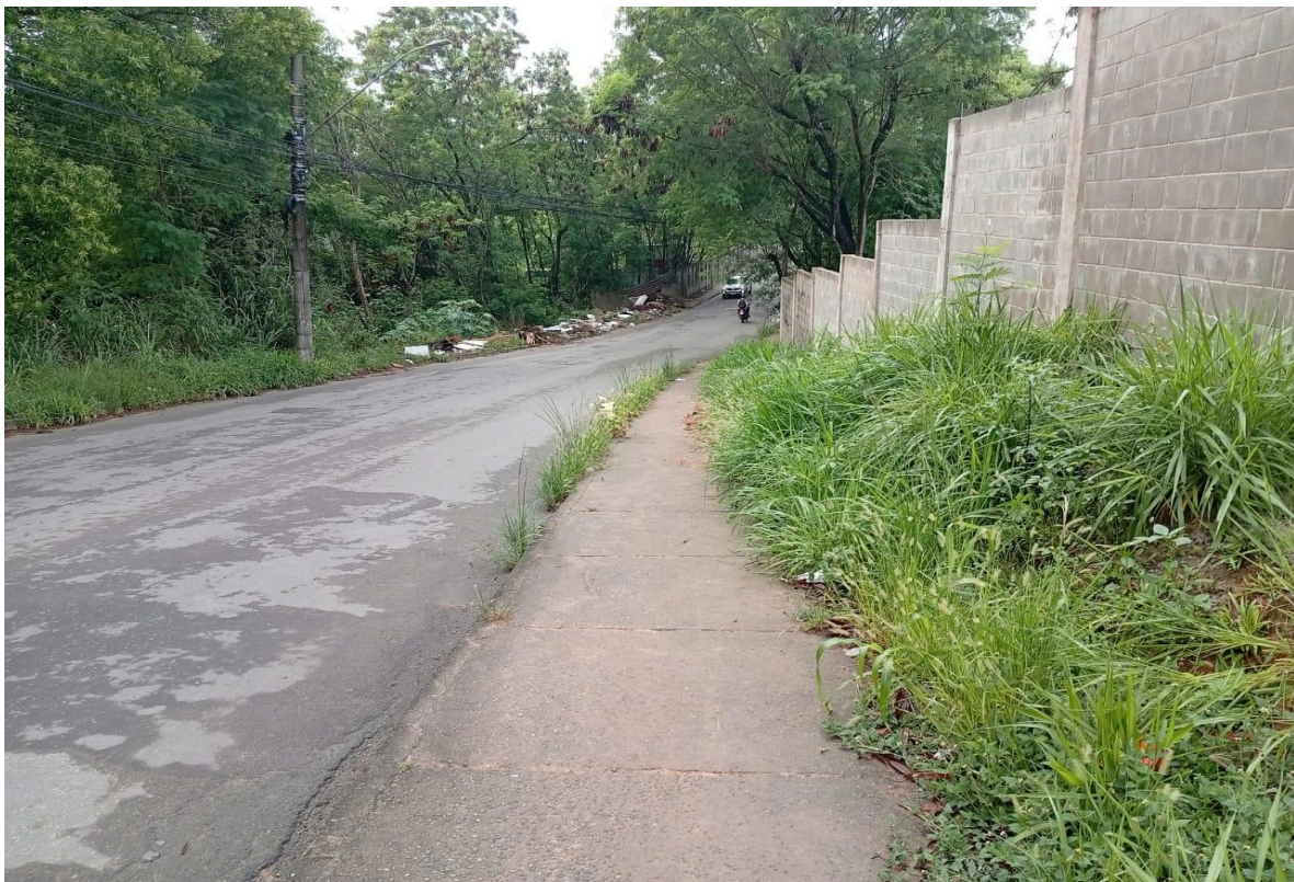
Imagem 2 - Vista da Rua Belo Horizonte II, S/N, Jardim Limoeiro, Serra - ES.

Rua Major Pissarra, 245 - Centro – Serra/ES – CEP: 29.176-020. Tel.: (27) 3251-8300 E-mail: gabinetegeorge@camaraserra.es.gov.br / Site: www.camara.serra.es.gov.br