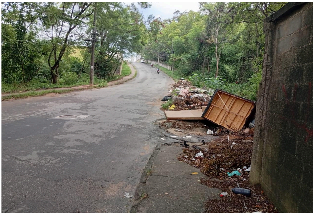
Imagem 2 - Vista da Rua Belo Horizonte II, S/N, Jardim Limoeiro, Serra - ES.

Rua Major Pissarra, 245 - Centro – Serra - ES – CEP: 29.176-020 – TEL (27) 3251-8300 E-mail: gabinetegeorge@camaraserra.es.gov.br / Site: www.camaraserra.es.gov.br