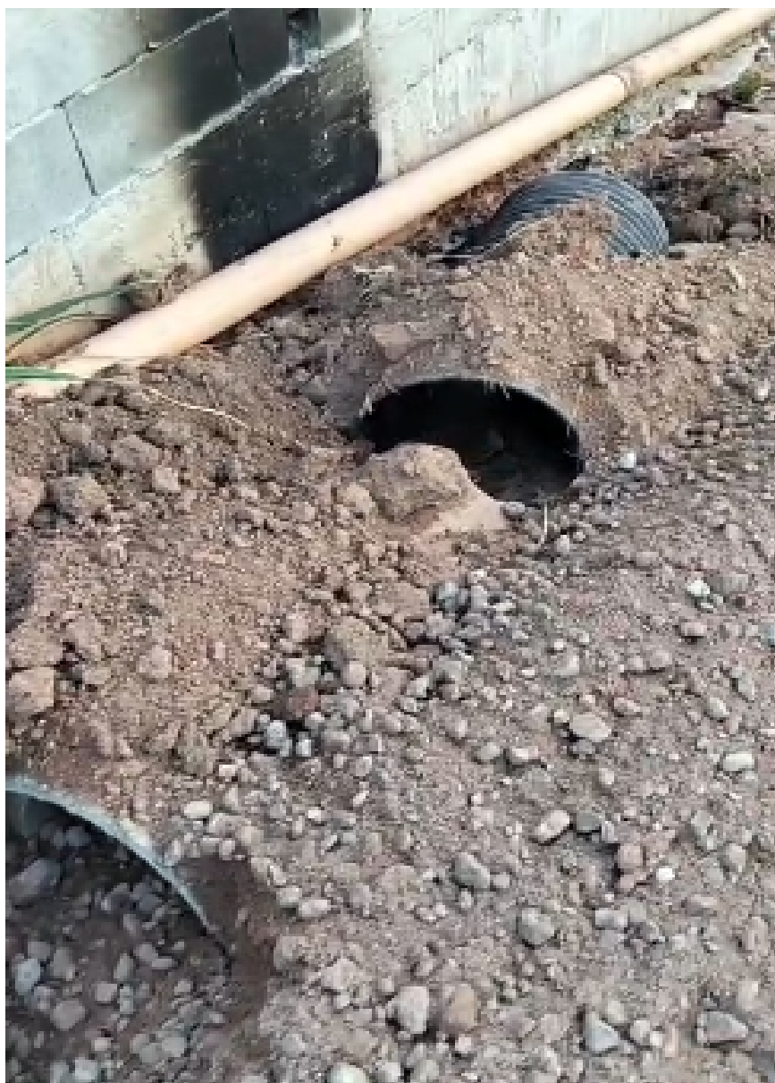
Imagem 3 - Vista da Rua Canárias, nº 03, Porto Dourado, Serra/ES.

Rua Major Pissarra, 245 - Centro – Serra - ES – CEP: 29.176-020 – TEL (27) 3251-8300 E-mail: gabinetegeorge@camaraserra.es.gov.br / Site: www.camaraserra.es.gov.br