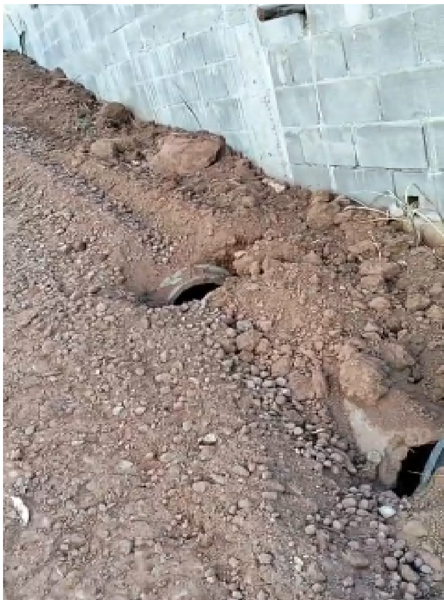
Imagem 2 - Vista da Rua Canárias, nº 03, Porto Dourado, Serra/ES.

Rua Major Pissarra, 245 - Centro – Serra - ES – CEP: 29.176-020 – TEL (27) 3251-8300 E-mail: gabinetegeorge@camaraserra.es.gov.br / Site: www.camaraserra.es.gov.br