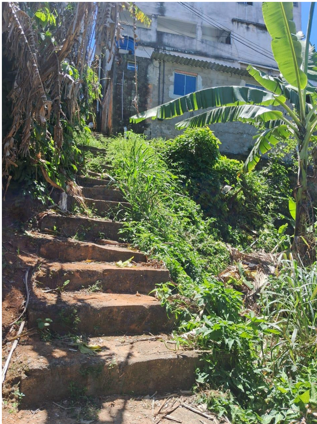
Imagem 2 - Vista do barranco, beco Boa Vista, s/n, Taquara II, Serra - ES.

Rua Major Pissarra, 245 - Centro – Serra/ES – CEP: 29.176-020. Tel.: (27) 3251-8300 E-mail: gabinetegeorge@camaraserra.es.gov.br / Site: www.camara.serra.es.gov.br