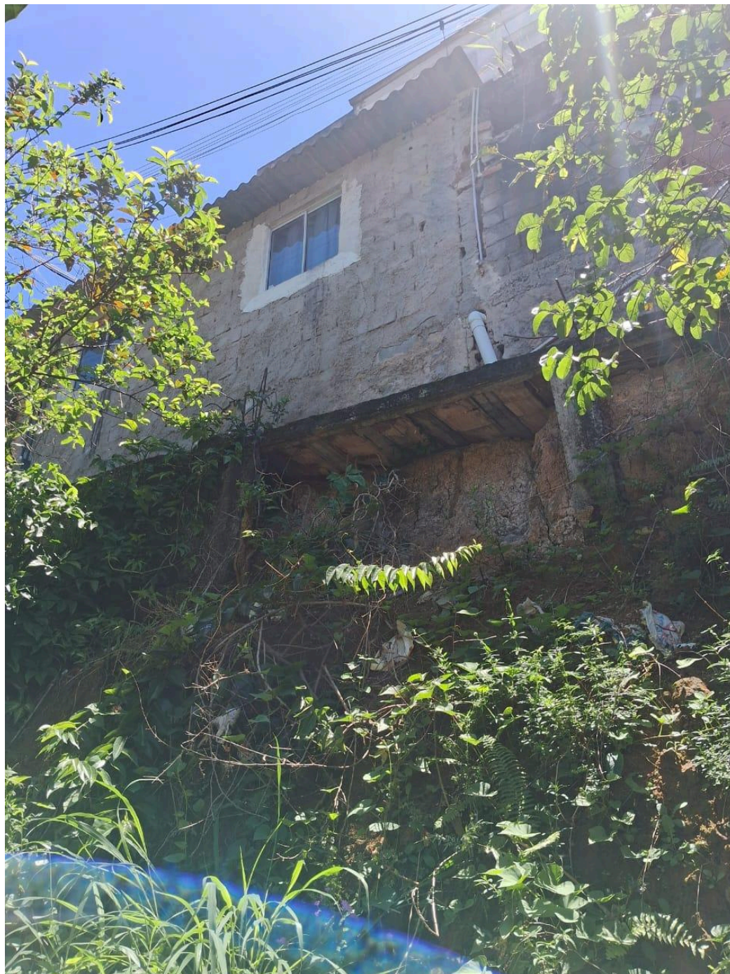
Imagem 3 - Vista do barranco, beco Boa Vista, s/n, Taquara II, Serra - ES.

Rua Major Pissarra, 245 - Centro – Serra/ES – CEP: 29.176-020. Tel.: (27) 3251-8300 E-mail: gabinetegeorge@camaraserra.es.gov.br / Site: www.camara.serra.es.gov.br