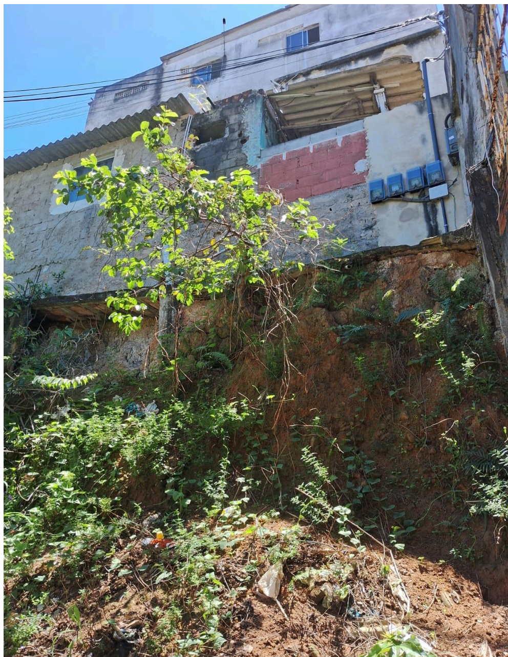
Imagem 4 - Vista do barranco, Beco Boa Vista, s/n, Taquara II, Serra - ES.

Rua Major Pissarra, 245 - Centro – Serra/ES – CEP: 29.176-020. Tel.: (27) 3251-8300 E-mail: gabinetegeorge@camaraserra.es.gov.br / Site: www.camara.serra.es.gov.br