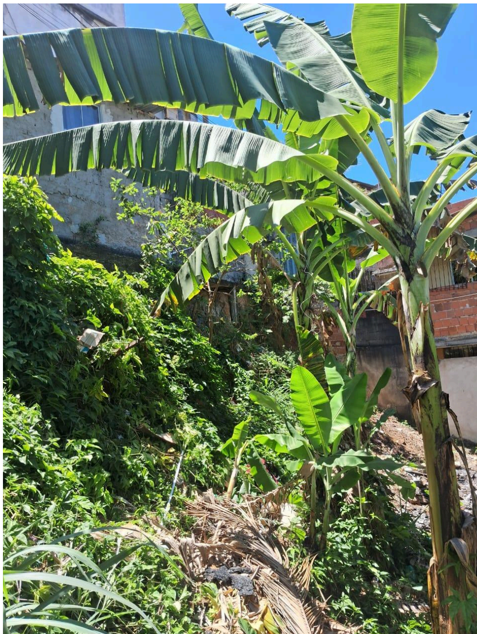
Imagem 5 - Vista do barranco, Beco Boa Vista, s/n, Taquara II, Serra - ES.

Rua Major Pissarra, 245 - Centro – Serra/ES – CEP: 29.176-020. Tel.: (27) 3251-8300 E-mail: gabinetegeorge@camaraserra.es.gov.br / Site: www.camara.serra.es.gov.br