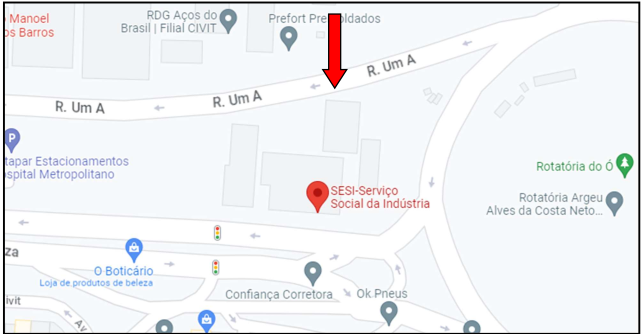
Parque Residencial Laranjeiras