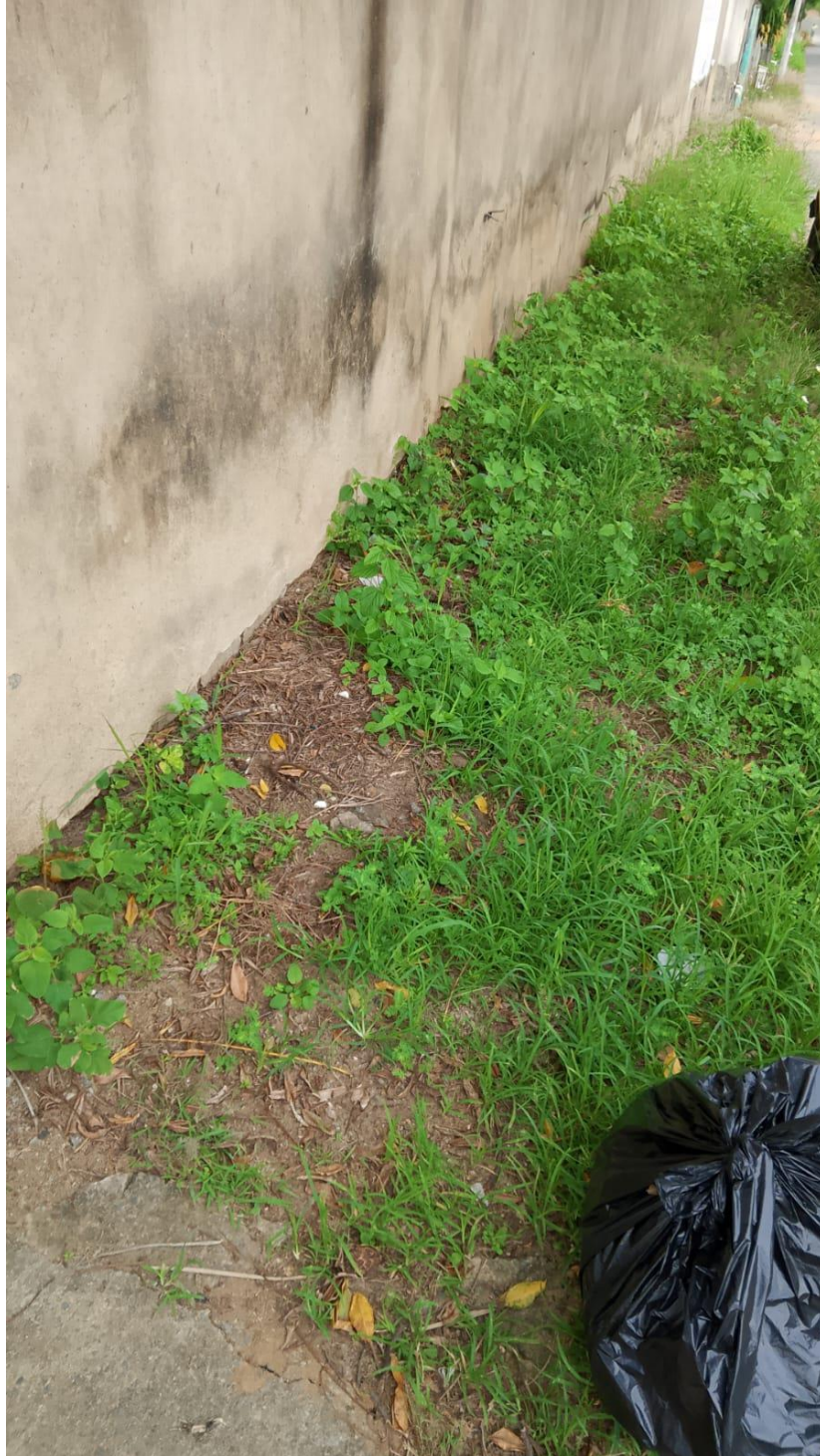
Palácio Judith Leão Castello Ribeiro

Rua Major Pissarra, 245 – Centro – Serra – ES – CEP 29.176-020 – Tel.: (27) 3251-8315