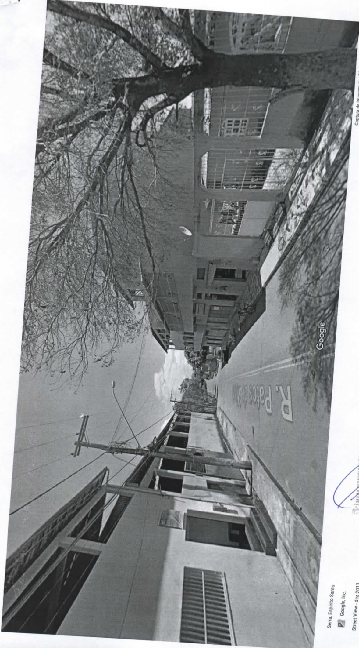
Captura da imagem: dez 2013 © 2018 Google

Serra, Espírito Santo Google, Inc. Street View - dez 2013