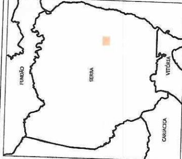
MAPA DE LOCALIZAÇÃO NO MUNICÍPIO DA SERRA