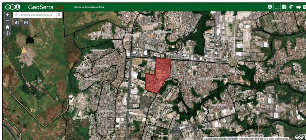
Imagem 1 – Delimitação atual do bairro Valparaíso