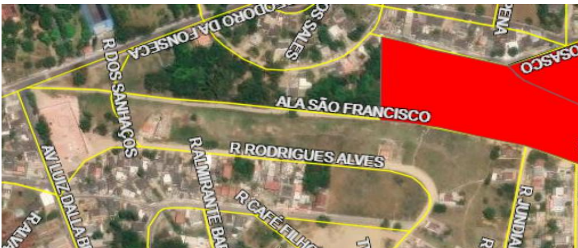
Figura 02: Rua Alameda São Francisco